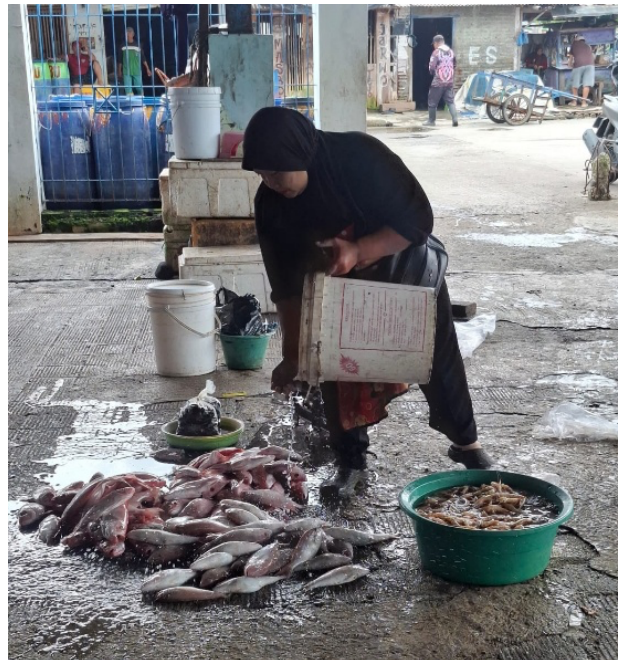
Figure 8 Fish cleansing by local traders at Asemtoyong Fish Landing Site

Menurut penelitian yang dilakukan oleh Zulfikar (2017), suhu standar air pencucian adalah 0-3° Celcius untuk menjaga kondisi ikan agar tetap segar dan untuk memperlambat aktivitas bakteri pembusuk. Pada pencucian ikan yang dilakukan oleh pedagang lokal di PPP Asemtoyong, Kabupaten Pematang, ikan dicuci menggunakan air tawar dengan gayung. Air yang digunakan oleh pedagang lokal adalah air sumur yang berasal dari lokasi tersebut. Kegiatan pencucian ikan yang dilakukan oleh pedagang lokal dapat dilihat pada Gambar 8 .