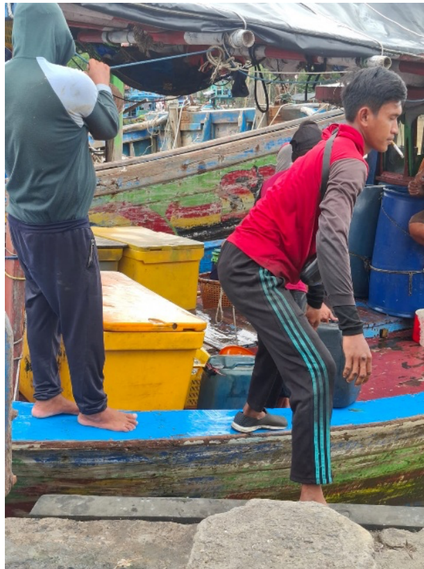
Figure 2 Catch unloading process from fish hold onto unloading jetty

disebabkan oleh penurunan suhu (Lumaela et al. 2023). Berdasarkan SNI 2729:2013 terkait petunjuk penanganan ikan segar, bahan baku harus ditangani secara cepat, cermat dan saniter dalam kondisi suhu dingin. Aktivitas persiapan bongkar muat dapat dilihat pada Gambar 2 .