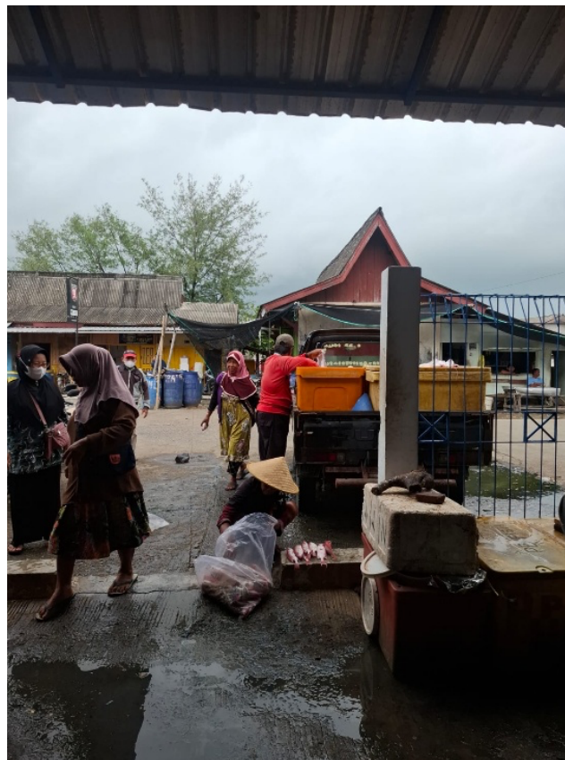
Figure 11 Preparations for distribution or marketing of fish catches to local markets

Pasar-pasar lokal di Pemalang biasa menjual ikan hasil penangkapan dari PPP Asemtoyong dan TPI Tanjungsari. Selain di Pemalang, hasil tangkapan ikan juga dikirim ke beberapa wilayah seperti ke Tegal, Cilacap, Pekalongan, serta ke luar provinsi. Hasil tangkapan ikan juga dikirim ke beberapa kota besar di Indonesia seperti Bandung dan Jakarta. Pengiriman hasil tangkapan dari TPI Asemtoyong ke pasar lokal yang ada di Pemalang dan kota sekitarnya ditunjukkan pada Gambar 11 .