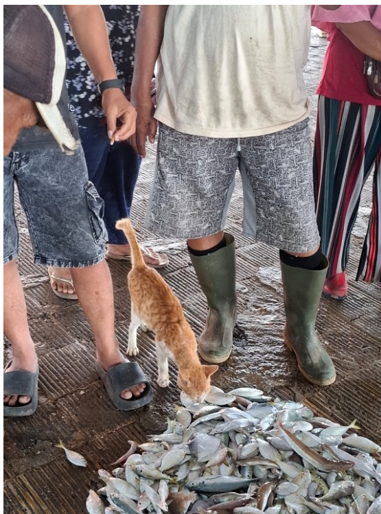
Figure 6 Animals (ie; cat – in above picture) can cause cross-contamination in fishery products

Harga ikan juga bergantung pada jenis ikan dan ukuran ikan. Menurut hasil pengamatan, ikan dilelang langsung di lantai TPI tanpa alas yang dapat menyebabkan kontaminasi bakteri dan menurunkan kualitas ikan. Selain itu, kontaminasi bakteri di TPI Asemdayong dapat disebabkan karena banyaknya hewan yang selalu melewati area pelelangan ikan seperti kucing yang ditunjukkan pada Gambar 6 .