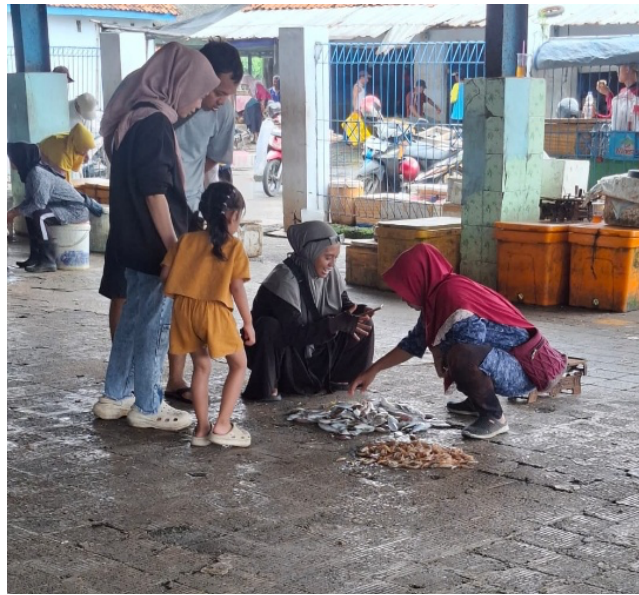
Figure 9 Consumers are buying fish at Asemtoyong Fish Landing Site

dengan harga sekitar Rp90.000. Kegiatan penimbangan ikan yang dilakukan oleh pedagang lokal di TPI Asemtoyong, Kabupaten Pematang Jaya ditunjukkan pada Gambar 10 .