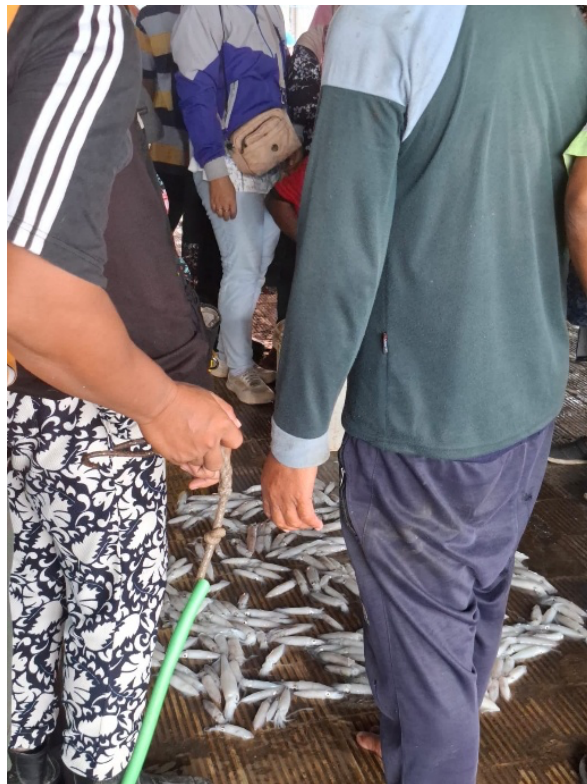
Figure 5 Fish sorting activities at the Asemtoyong Fish Landing Site

Gambar 4 Nelayan mengangkut hasil tangkapan ke TPI Asemtoyong menggunakan gerobak