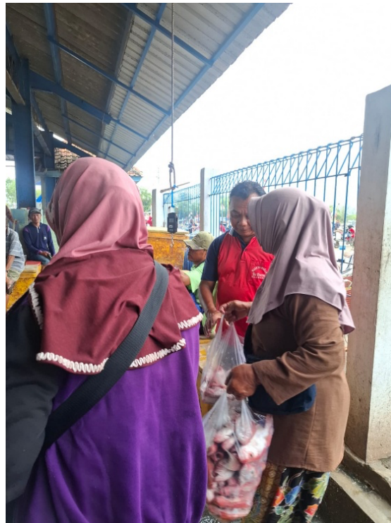
Figure 10 Weighing of fish catches that have already been purchased by consumers

Gambar 9 Konsumen membeli hasil tangkapan ikan di area TPI Asemtoyong