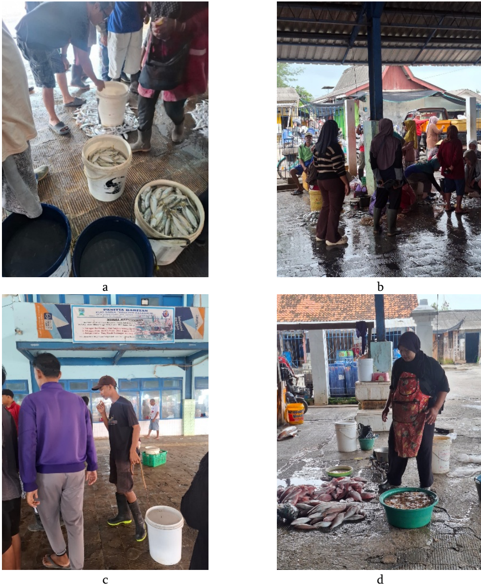
Figure 7 Various activities at Asemtoyong Fish Landing Site