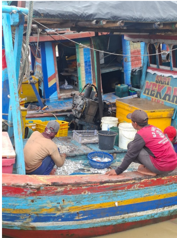
Figure 3 Onboard catch sorting process

tangan oleh calon pedagang yang sudah menunggu kapal melaut. Hal ini dapat menyebabkan mutu ikan turun karena adanya risiko terkontaminasi bakteri dari calon pedagang tersebut. Berdasarkan hasil pengamatan, terdapat 2 gerobak yang biasa mengangkut hasil tangkapan ikan dari nelayan ke tempat pelelangan ikan yang berjarak sekitar 30 meter. Gambar 4 menunjukkan nelayan yang sedang mengangkut hasil tangkapan ikan menggunakan gerobak.