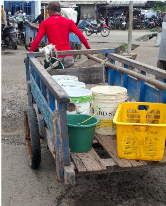
Figure 4 Fishermen transport their catch to Asemtoyong Fish Landing Site using carts

Gambar 4 Nelayan mengangkut hasil tangkapan ke TPI Asemtoyong menggunakan gerobak