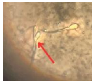
Spermatozoa abnormal memiliki 2 kepala

Penelitian ini melakukan pengamatan morfologi spermatozoa untuk mengidentifikasi bentuk abnormal yang muncul pada setiap perlakuan. Pengamatan tersebut bertujuan untuk mengevaluasi tingkat kelainan morfologis sebagai indikator kualitas semen. Hasil visualisasi spermatozoa abnormal disajikan pada Gambar 2.