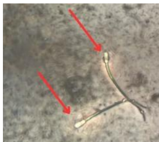
Spermatozoa tampak terang karena tidak menyerap zat warna