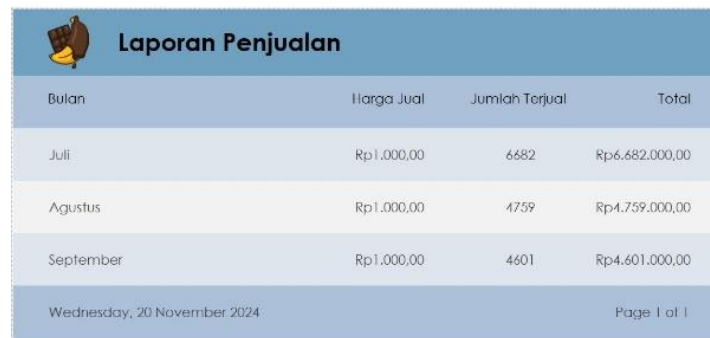
Gambar 3. Tampilan Report Penjualan

Inovasi menjadi kunci keberlanjutan usaha. UMKM Piscok dapat memanfaatkan tren pasar, seperti mengembangkan varian rasa baru atau menciptakan kemasan yang lebih menarik untuk meningkatkan daya tarik produk. Selain itu, penggunaan platform digital untuk pemasaran dapat membantu menjangkau pasar yang lebih luas dan meningkatkan penjualan. Dengan demikian, pertumbuhan usaha dapat berjalan seiring dengan perbaikan kinerja keuangan. Inovasi adalah faktor utama dalam persaingan, membantu menciptakan ide, proses, dan produk baru yang mendukung kemajuan bisnis (Susilowati et al. 2024). Dengan demikian, investasi pada inovasi dapat menjadi langkah strategis untuk memulihkan pendapatan.