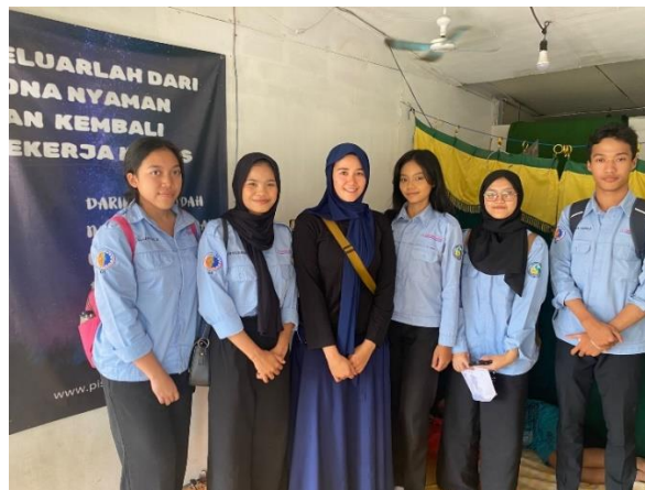
Gambar 1. Dokumentasi Wawancara

Penelitian ini dilaksanakan di salah satu UKM kuliner di Nanggung, Kota Bogor, yaitu UKM Piscok Bogor Asri. Lokasi ini dipilih karena Nanggung merupakan wilayah dengan pertumbuhan UKM yang pesat, khususnya di bidang kuliner, di mana produk piscok memiliki permintaan yang tinggi. UKM Piscok Bogor Asri dipilih sebagai fokus penelitian karena mewakili tantangan yang dihadapi oleh banyak UKM serupa, seperti pengelolaan modal, pencatatan keuangan, dan pertumbuhan usaha. Tantangan-tantangan ini menjadi alasan utama penelitian, mengingat dampaknya yang signifikan terhadap kinerja keuangan jangka panjang.