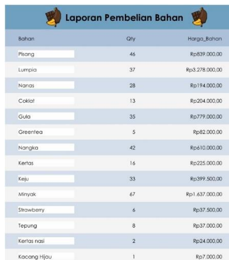
Gambar 4. Tampilan Form Keuntungan Juli

Efisiensi operasional adalah kunci untuk menjaga keuntungan dalam jangka panjang. Operasi yang efisien memungkinkan perusahaan memproduksi barang dengan biaya lebih rendah, memanfaatkan sumber daya secara optimal, dan merespons pelanggan lebih cepat (Istiqomah et al. 2023). Pada UMKM Piscok, biaya bahan baku seperti lumpia dan minyak mencatat pengeluaran terbesar, masing-masing Rp3.278.000,00 dan Rp1.637.000,00. Hal ini menyebabkan rasio keuntungan menurun dari 46,7% pada Juli menjadi 35,6% pada September. Tampilan Form Keuntungan Juli dapat dilihat pada Gambar 4.