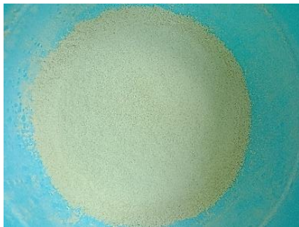
Gambar 1. Tepung gembolo ukuran 80 mesh

kan hingga suhu 40–43 °C dengan kondisi tertutup. Susu kemudian diinokulasi menggunakan campuran starter bakteri Lactobacillus acidophilus dan Bifidobacterium sp sebanyak 1 g dan diinkubasi pada inkubator (Mettler, Jerman) suhu 37 °C selama 24 jam, sehingga dihasilkan starter F1. Pembuatan starter F2 dilakukan dengan cara yang sama dan susu UHT 100 mL diinokulasi menggunakan F1 sebanyak 3%. Pemiakan starter terus dilakukan hingga dihasilkan starter kerja F3, sehingga didapatkan formulasi starter BAL dengan karakteristik yang diinginkan, yaitu starter tidak terlalu padat dan rasa asam tidak terlalu pekat.