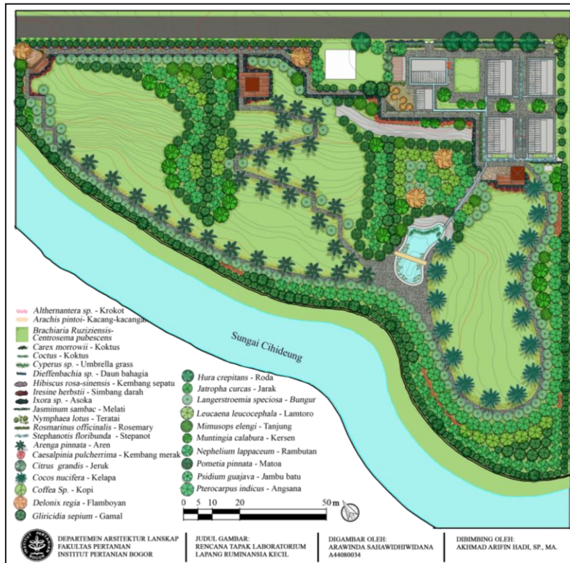
Gambar 4. Rencana Tapak