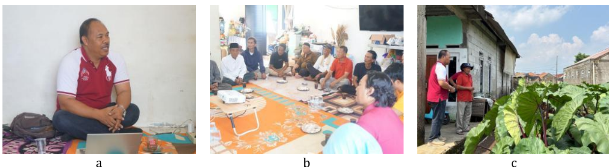
Gambar 3 Pelaksanaan pelatihan: a) Penyampaian materi, b) Peserta pelatihan, dan c) Observasi lapang.

Pada aspek efisiensi biaya, 31,25% peserta menyatakan biaya usahatani menjadi lebih