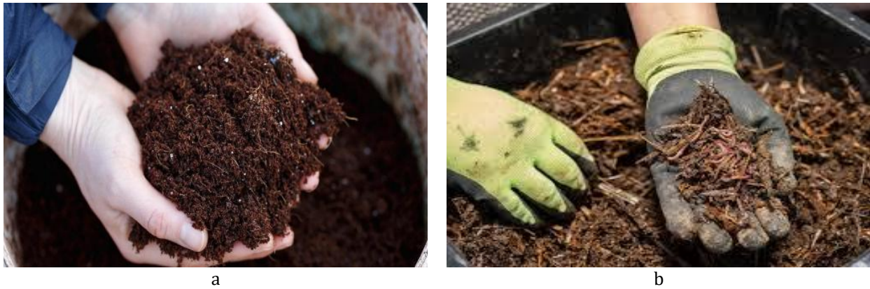
Gambar 6 a) Pupuk organik berbasis Mikroba dan b) Mulsa organik dari daun kering.