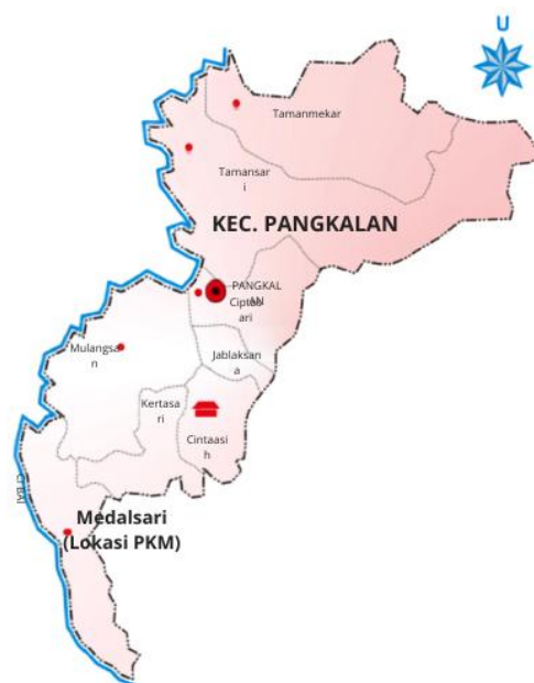
Gambar 1 Lokasi kegiatan pengabdian.

Tahapan sosialisasi dilaksanakan melalui metode ceramah, diskusi, dan tanya jawab sehingga selain tim pengabdian menyampaikan kegiatan yang akan dilaksanakan, petani kopi juga dapat menyampaikan permasalahan yang dihadapi selama proses budidaya, pengolahan kopi, maupun pengelolaan limbah. Pada akhir