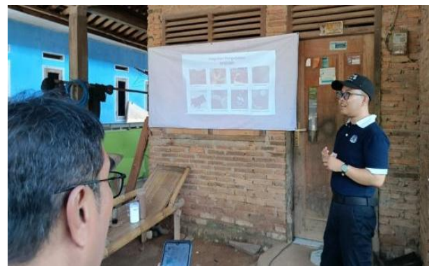
Gambar 5 Kegiatan penyampaian materi teknik budidaya kopi.

Peningkatan pengetahuan peserta diukur dengan pre-test dan post-test . Berdasarkan hasil pre-test dan post-test yang disajikan pada Tabel 1, terlihat adanya peningkatan yang signifikan pada pengetahuan petani kopi terkait praktik produksi kopi ramah lingkungan dan berkelanjutan sesuai prinsip Good Agricultural Practices (GAP). Sebelum kegiatan dilakukan, tingkat penge-