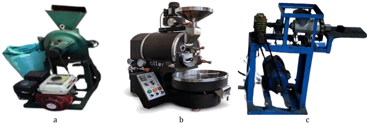
Gambar 7 a) Mesin huller, b) Mesin roasting, dan c) Mesin ekstruder.