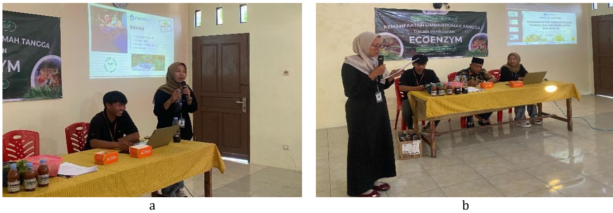
Gambar 3 a dan b) Sosialisasi produksi pupuk organik cair.

penyuluhan ini berhasil meletakkan dasar awal untuk menumbuhkan kesadaran kolektif dalam pengelolaan sampah rumah tangga berbasis komunitas. Hal ini menghasilkan peningkatan keterampilan dan pengetahuan di antara para mitra mengenai pentingnya pengelolaan sampah organik di lingkungan rumah tangga. Para mitra mulai memisahkan sampah organik dan anorganik dan menyatakan minat untuk melanjutkan praktik ini secara berkelanjutan. Hasil kegiatan ini menunjukkan dampak positif pada pengetahuan, keterampilan, dan sikap terhadap isu-isu lingkungan.