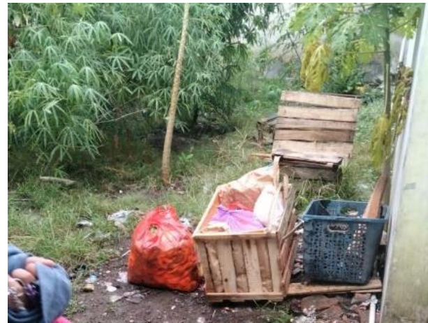
Gambar 2 Pengumpulan bahan organik (limbah buah segar).

bagi masyarakat untuk mempelajari cara memilah sampah dengan benar dan memahami pentingnya pengelolaan sampah dari rumah (Wedagama & Suryanti 2024). Sosialisasi diadakan pada hari Kamis, 1 Mei 2025, di balai pertemuan Dusun Lemusir. Acara ini dihadiri oleh 19 peserta, terdiri dari ibu-ibu PKK dan kepala RT. Kegiatan berlangsung dalam suasana interaktif dan komunikatif. Materi sosialisasi disampaikan oleh tim proyek dalam bentuk presentasi visual menggunakan proyektor LCD dan slide PowerPoint. Beberapa topik utama yang dibahas meliputi: definisi, alat dan bahan, metode pembuatan, cara penggunaan, dan manfaat. Sebagai bentuk keterlibatan langsung, tim proyek menunjukkan contoh produk pupuk organik cair fermentasi jadi sehingga peserta dapat langsung melihat bentuk, warna, dan aroma produk akhir. Pupuk organik cair yang dihasilkan oleh peserta dianggap berhasil jika memenuhi beberapa kriteria: warna cokelat, aroma buah yang khas dengan sedikit aroma alkohol, pH asam (3-4), dan bebas dari jamur atau belatung (Muarief et al. 2024). Sosialisasi disampaikan oleh satu presenter, seperti yang ditunjukkan pada Gambar 3.