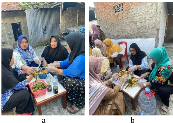
Gambar 4 a dan b) Pelatihan pembuatan pupuk organik cair.

Beberapa peserta mengusulkan pembentukan kelompok kerja lingkungan di tingkat unit