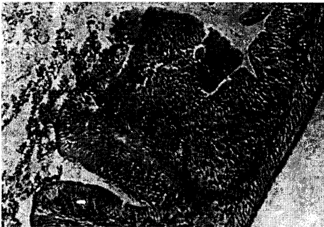
Gambar 5. Degenerasi Jaringan Ikat pada Usus (tanda panah). Pewarnaan Azan (Heidenhain). Pembesaran 465 x.