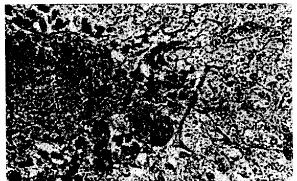
Gambar 3. Degenerasi Jaringan Ikat dan Pembendungan Darah pada Hati Ikan Nila. Pewarnaan Masson Trichrome (Goldner). Pembesaran 465x. 1. Degenerasi Jaringan Ikat, 2. Pembendungan Darah

Organ usus pada kelompok yang mendapatkan perlakuan mengalami kerusakan pada mukosa usus, hipertrofi, nekrosis, pendarahan lamina propria dan degenerasi jaringan ikat (Gambar 4 dan 5). Ikan mujair ( Oreochromis mossambicus ) akan mengalami penurunan kecepatan memakan ( feeding rate ), penyerapan makanan dan metabolisme secara nyata setelah terpapar phosphamidon dengan dosis sublethal phosphamidon selama 30 hari pada suhu 29 °C di laboratorium (Shanmugavel et al. , 1988). Efek yang sama juga terlihat pada ikan Puntius sarana yang terpapar oleh bensena heksaklorida (BHC) selama 15 hari (Moitra dan Lal, 1989). Menurut Khillare dan Wagh (1988), kerusakan pada saluran pencernaan akan mempengaruhi aktivitas dan fungsi enzim