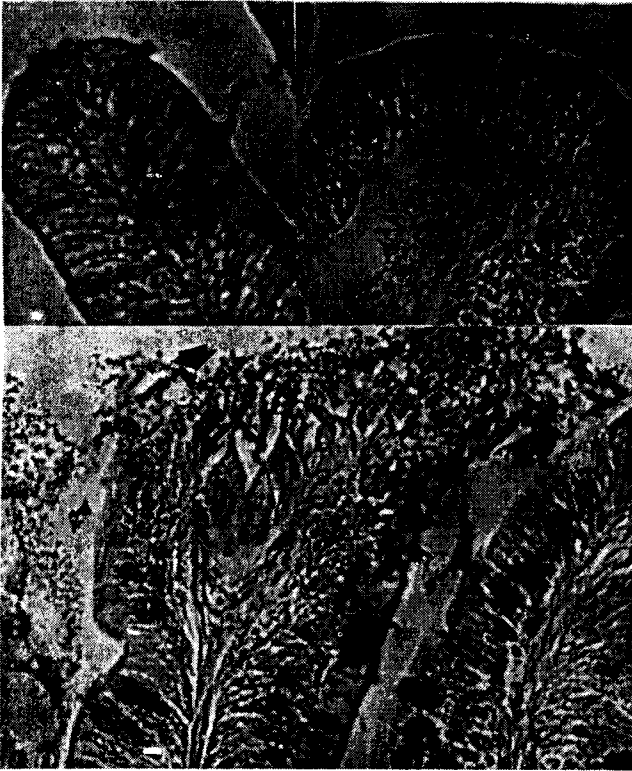
Gambar 4. Gambaran Histologik Usus Ikan Nila. Pewarnaan Alcian Blue. Pembesaran 465 x. A. Gambaran Normal, B. Hipertrofi, Pendarahan (*); C. Nekrosis (tanda panah).

pencernaan yang mengakibatkan gangguan proses pencernaan dan penyerapan makanan.