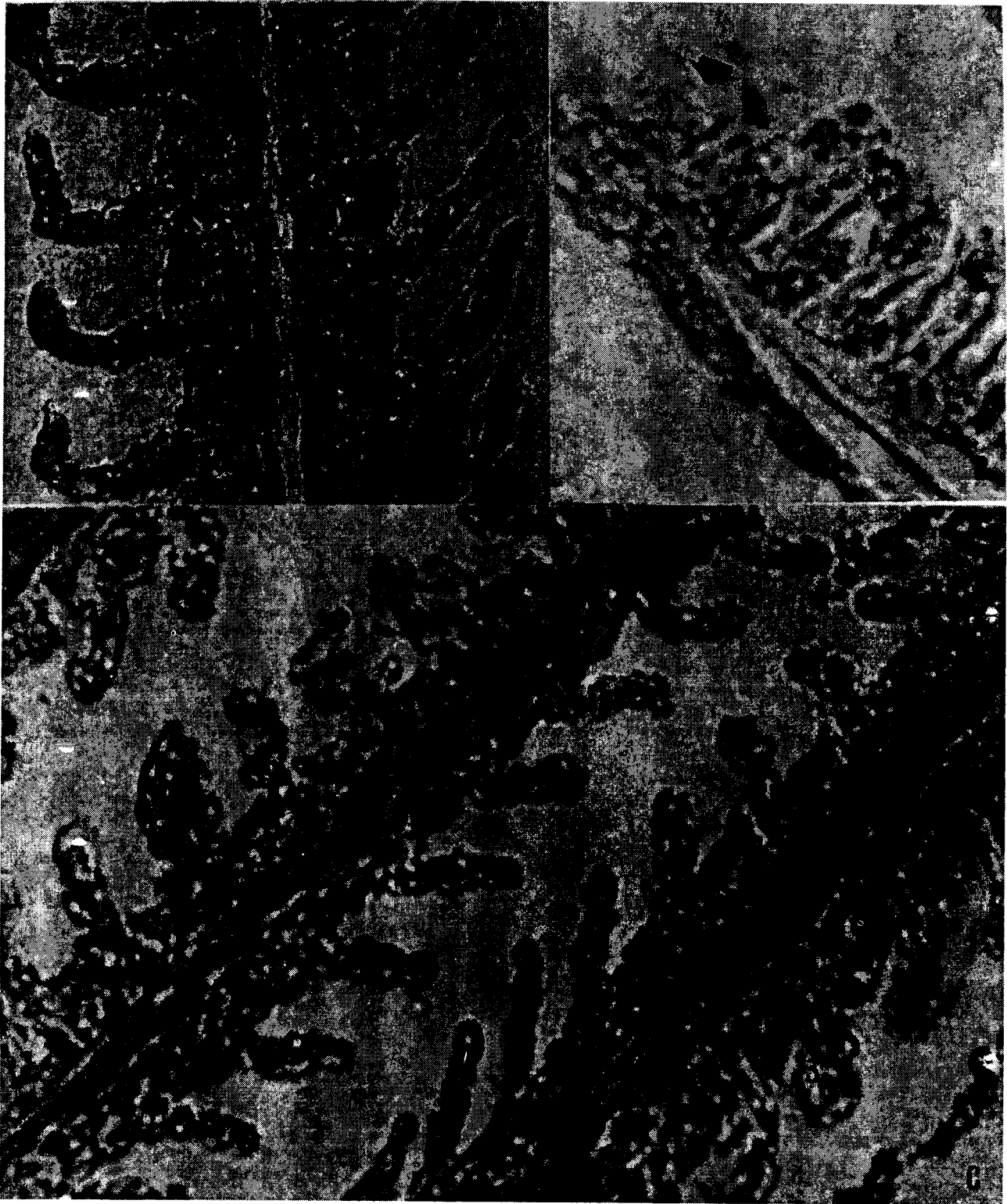
Gambar 1. Gambaran Histologik Insang Ikan Nila, Azan (Heidenhain), pembesaran 465 x. A. Gambaran Normal, B. Nekrosis (tanda panah); C. 1. Degenerasi Jaringan Ikat, 2. Hipertrofi dan 3. Fusi Lamela Sekunder