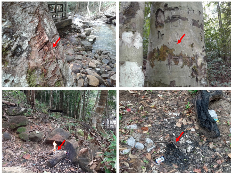
Gambar 3. Vandalisme pada beberapa pohon di sekitar Gunung Tajam (Gurok Beraye) (atas). Pembakaran sampah di sekitar lokasi Gurok Beraye dan Batu Mentas (bawah)