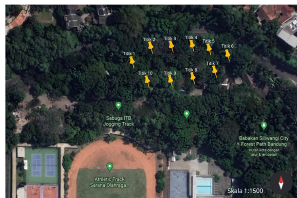
Gambar 1. Lokasi titik pengamatan di Babakan Siliwangi City Forest Path Bandung

Metode pengumpulan data dalam penelitian ini yaitu metode Point Count dengan mengikuti jalur yang telah ada berupa jembatan sepanjang 2,3 km (Gambar 1 dan 2). Titik pengamatan diambil \pm 400 meter dari pintu masuk dan pintu keluar jembatan dengan jarak antar titik pengamatan sejauh 150 meter dengan radius pengamatan 30 meter dengan lama pengamatan di setiap titik hitung selama 15 menit (Safanah et al. 2017). Semua burung yang terlihat atau terdengar dalam radius pengamatan dicatat,