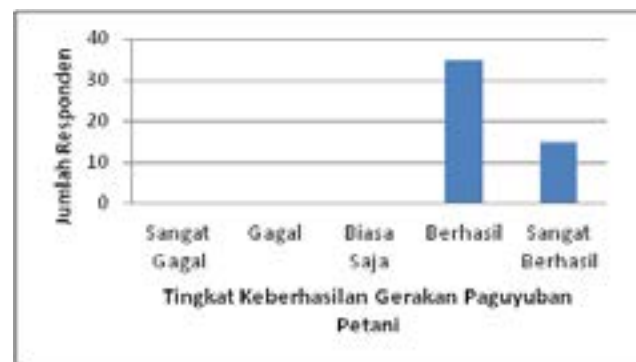
Gambar 1. Tingkat Keberhasilan Gerakan Paguyuban Petani Menurut Responden di Desa Sukamulya Tahun 2013

Tingkat keberhasilan gerakan Paguyuban Petani ditentukan secara keseluruhan oleh empat variabel yang telah disebutkan sebelumnya. Hasil kumulatif dari keseluruhan variabel untuk mengukur tingkat keberhasilan Paguyuban Petani dapat dilihat pada gambar berikut ini.