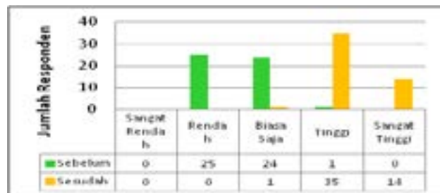
Gambar 3. Tingkat Kesejahteraan Sosial Masyarakat Desa Sukamulya Sebelum dan Sesudah Munculnya Paguyuban Petani Tahun 2013

paling banyak dari skala buruk menjadi skala biasa saja. Responden menilai bahwa TNI AU sudah mulai kooperatif sehingga masyarakat juga mulai biasa saja saat menghadapi mereka. Responden menyatakan bahwa selama TNI AU tak lagi memojokkan mereka, maka masyarakat juga akan bersikap biasa saja. Ketiga variabel tersebut dijadikan dalam satuan tingkat kesejahteraan sosial masyarakat.