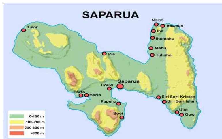
Gambar 1. Peta lokasi penelitian

Untuk memahami peran lembaga adat kewang sebagai biosecurity strategy , maka penulis menggunakan perspektif ekonomi kelembagaan lama (EKL) yang memandang tindakan manusia dibatasi sekaligus didorong oleh lembaga yang ada di sekitarnya (Chang 2003; Helmsing 2003); Helmsing 2003). Dengan demikian, cara berpikir dan berperilaku individu dan kelompoknya adalah proyeksi dari kebiasaan dan aturan yang membentuk kelembagaan lokal (Challen dan Schilizzi 1999; North 1990). Penulis menggunakan pendekatan penelitian kualitatif dengan metode studi kasus. Penelitian ini dilakukan di negeri Booi, pulau Saparua, Kabupaten Maluku Tengah. Berikut ini Gambar 1 merupakan peta lokasi penelitian