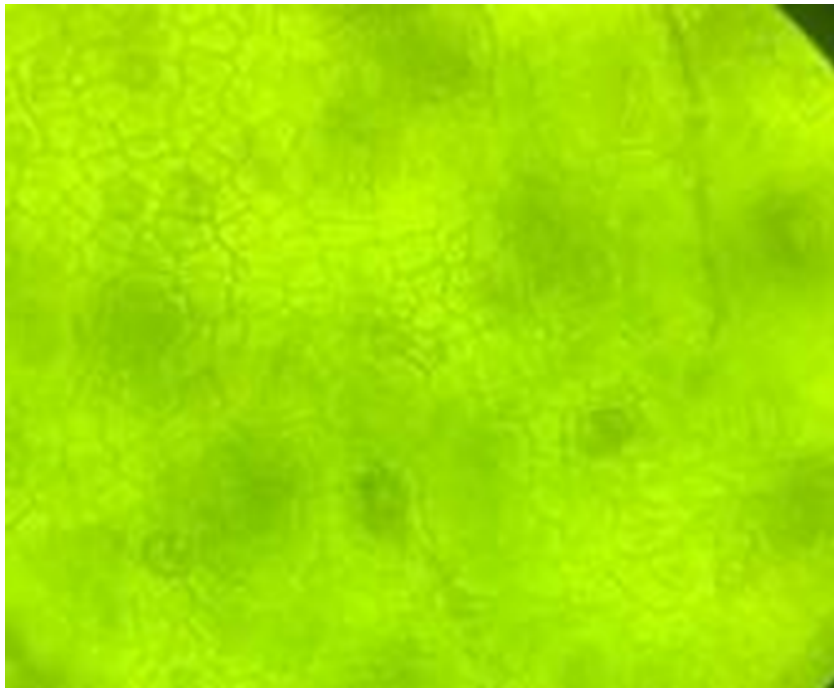
Figure 2 Stomata Bruguiera gymnorrhiza

Berdasarkan hasil pengamatan mikroskop pada preparat daun Bruguiera gymnorrhiza , terlihat struktur epidermis dengan sel-sel berbentuk poligonal tidak beraturan. Diantara sel-sel epidermis tersebut tampak stomata yang berbentuk oval/elips dengan sepasang sel penutup (guard cells) yang menyerupai bentuk biji kopi. Celah stomata (porus) terlihat jelas di tengah sel penutup. Figure 2 menunjukkan stomata terlihat menyebar diantara sel-sel epidermis yang masih mengandung klorofil, menunjukkan bahwa stomata berada pada permukaan daun yang aktif berfotosintesis (Naeem et al. , 2019).