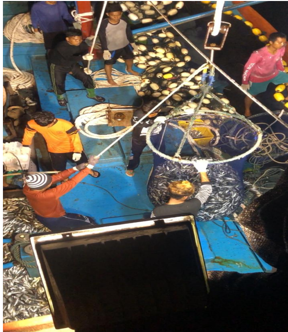
Gambar 3 Menaikkan ikan ke atas kapal

Penanganan selanjutnya penyortiran ikan yaitu ikan dipilih atau disortir berdasarkan jenis dan kualitasnya. Ukuran ikan tidak menjadi perhatian selama 6 bulan penangkapan tersebut karena ikan yang tertangkap dengan ukuran yang hampir sama. Penelitian sebelumnya oleh Suryanto et al. (2020), juga menyebutkan bahwa tahap penyortiran dilakukan untuk memisahkan ikan sesuai kategori jenis, ukuran dan kualitasnya. Proses penanganan selanjutnya, ikan yang sudah dipilih tersebut akan dimasukkan ke dalam keranjang untuk dicuci. Sementara itu, ikan dengan kualitas yang kurang seperti rusak atau busuk akan dikelompokkan lagi menjadi dua yaitu dimanfaatkan kembali untuk dikonsumsi atau dibuang. Sari et al. (2019) juga menyebutkan bahwa pengelompokan ikan dapat dibedakan menjadi ikan yang dimanfaatkan kembali untuk konsumsi atau dijual ( retained species ) dan ikan yang dibuang ( discarded species ). Penelitian sebelumnya oleh Tani et al. (2020), ikan hasil tangkapan yang rusak, tidak laku di pasaran, dan bukan merupakan ikan target akan dibuang. Penelitian lainnya oleh Pramesthy et al. (2022) menyatakan bahwa pemilahan ikan berdasarkan jenis diikuti dengan kualitas ikan yang tidak bagus atau rusak serta tidak memiliki nilai jual maka akan dibuang. Proses penyortiran disajikan pada Gambar 4.