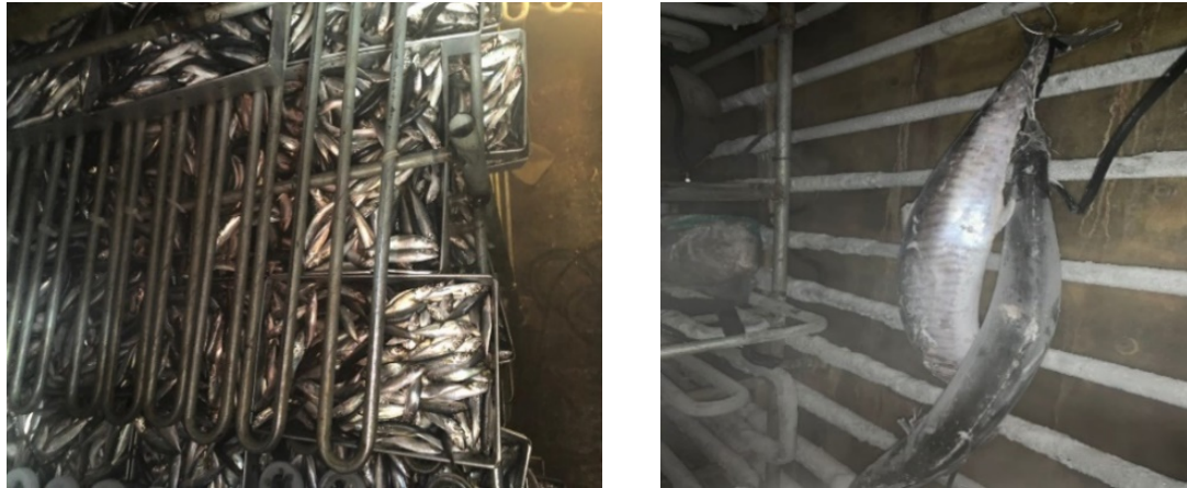
Gambar 6. Pembekuan ikan

pembekuan memiliki peran penting dalam mengubah kandungan air pada ikan menjadi es, agar aktivitas mikroba dan enzim menjadi terhambat. Proses pembekuan ikan merupakan tahap yang sangat penting dan krusial dalam menjaga kesegaran dan mutu ikan. Hal ini didukung oleh hasil penelitian sebelumnya yang menyatakan bahwa salah satu sistem penanganan ikan yang sangat berpengaruh terhadap penurunan mutu ikan adalah adanya sistem rantai dingin, dalam hal ini adalah proses pembekuan pada ikan (Rossarie et al. 2021). Proses pembekuan ikan disajikan pada Gambar 6.