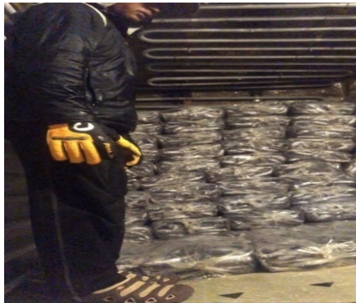
Gambar 8 Penyimpanan ikan