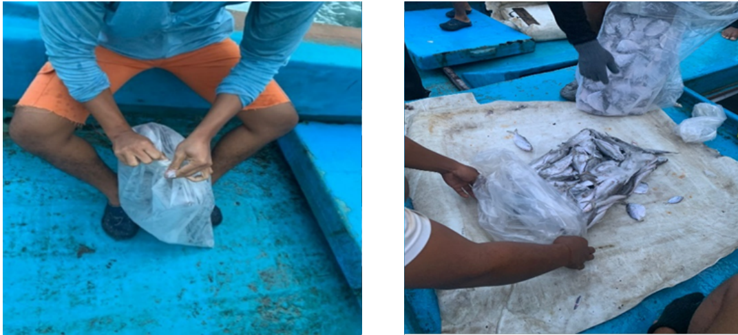
Gambar 7 Pengemasan ikan

menghindari proses pembusukan yang cepat pada ikan akibat kontaminasi dari bakteri. Proses penanganan ikan pada tahap ini dapat dilihat pada Gambar 8.