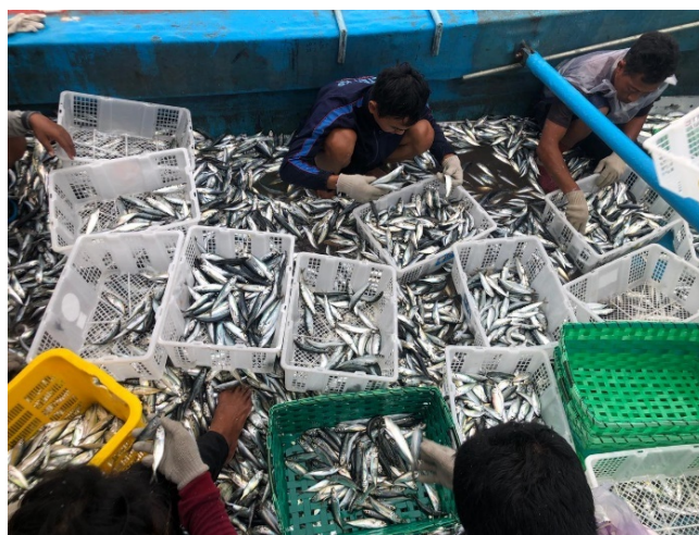
Gambar 4 Penyortiran ikan

Penanganan selanjutnya penyortiran ikan yaitu ikan dipilih atau disortir berdasarkan jenis dan kualitasnya. Ukuran ikan tidak menjadi perhatian selama 6 bulan penangkapan tersebut karena ikan yang tertangkap dengan ukuran yang hampir sama. Penelitian sebelumnya oleh Suryanto et al. (2020), juga menyebutkan bahwa tahap penyortiran dilakukan untuk memisahkan ikan sesuai kategori jenis, ukuran dan kualitasnya. Proses penanganan selanjutnya, ikan yang sudah dipilih tersebut akan dimasukkan ke dalam keranjang untuk dicuci. Sementara itu, ikan dengan kualitas yang kurang seperti rusak atau busuk akan dikelompokkan lagi menjadi dua yaitu dimanfaatkan kembali untuk dikonsumsi atau dibuang. Sari et al. (2019) juga menyebutkan bahwa pengelompokan ikan dapat dibedakan menjadi ikan yang dimanfaatkan kembali untuk konsumsi atau dijual ( retained species ) dan ikan yang dibuang ( discarded species ). Penelitian sebelumnya oleh Tani et al. (2020), ikan hasil tangkapan yang rusak, tidak laku di pasaran, dan bukan merupakan ikan target akan dibuang. Penelitian lainnya oleh Pramesthy et al. (2022) menyatakan bahwa pemilahan ikan berdasarkan jenis diikuti dengan kualitas ikan yang tidak bagus atau rusak serta tidak memiliki nilai jual maka akan dibuang. Proses penyortiran disajikan pada Gambar 4.