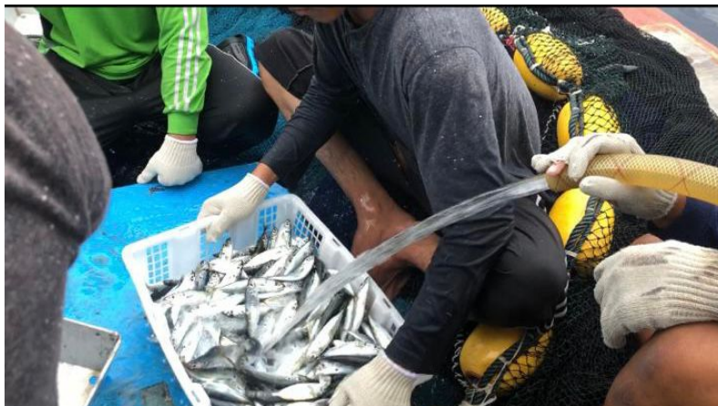
Gambar 5 Pencucian ikan

Tahapan pencucian ini yaitu ikan dicuci dengan air laut menggunakan selang. Proses pencucian sendiri yaitu dengan menggoyangkan keranjang yang berisi ikan sambil disiram dengan air dari selang. Hal ini dilakukan agar ikan bersih dari darah dan sisik yang terlepas sebelum nantinya ikan dibekukan. Penelitian sebelumnya oleh Litaay et al. (2020) juga menyebutkan bahwa selama proses pencucian ikan sesekali disemprot dan disiram dengan air laut. Nilai jual ikan nantinya tentu juga akan sangat tergantung dari kebersihan ikan tersebut, sehingga proses ini menjadi tahap penting dalam penanganan ikan di atas kapal. Hal ini didukung oleh hasil penelitian sebelumnya oleh Sipahutar et al. (2019), yang menyatakan bahwa air untuk proses pencucian ikan dapat diambil dari tengah laut untuk mencuci ikan agar darah maupun kotoran lainnya yang menempel pada ikan dapat hilang sehingga ikan bersih. Menurut Nurani et al. (2013), pencucian ikan dilakukan hingga seluruh sisa darah yang ada pada ikan hilang, dibersihkan dengan memasukkan selang ke dalam insang ikan. Proses pencucian ikan tersebut dapat dilihat pada Gambar 5.