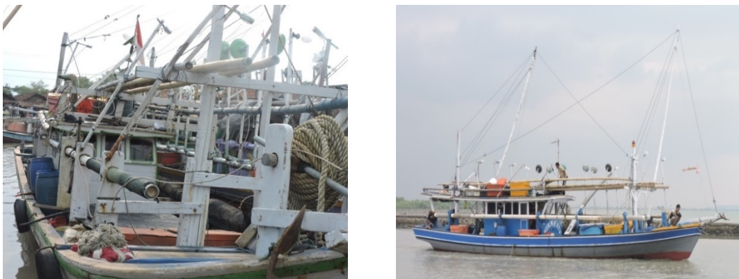
Gambar 1 Bagan congkel yang dioperasikan di PPN Karangantu