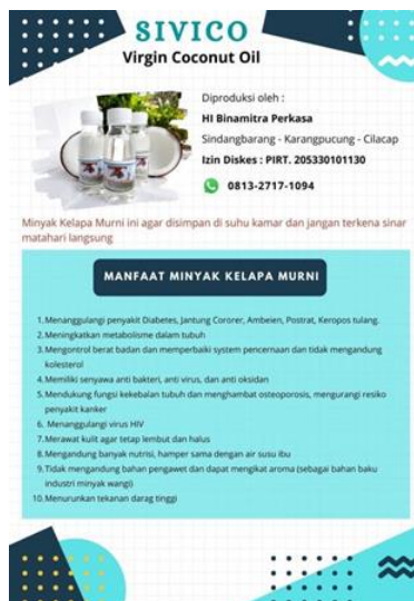
Gambar 5. Brosur produk UMKM VCO

Strategi branding bagi sebuah perusahaan merupakan salah satu hal penting yang berpengaruh terhadap kesuksesan sebuah perusahaan. Branding memiliki konsep bahwa yang perlu dilihat bukan hanya membuat target pemasaran, memilih kita di dalam pasar yang penuh kompetisi, namun juga membuat prospek. Prospek pemasaran melihat merek ( brand ) kita sebagai satu-satunya yang dapat mengatasi atau memberikan solusi bagi mereka. Maka dari itu, penting bagi suatu usaha memiliki nama merek dagang atau brand untuk produknya. Brand atau merek sebuah produk adalah tanda, simbol, desain atau kombinasi dari semuanya untuk mengidentifikasikan suatu produk atau jasa yang membedakan dengan produk atau jasa kompetitor (Kotler dan Keller 2012). Sedangkan pada UMKM VCO belum memiliki merek dagang yang jelas dan selama ini masih menggunakan nama usaha HI Binamitra Perkasa untuk promosinya. Sehingga tim KKN-T IPB 2021 mengusulkan pembuatan nama merek dagang produk VCO, dan didapatkan nama "SIVICO" yang berasal dari Sindangbarang Virgin Coconut Oil.