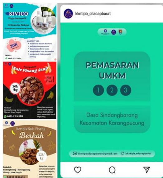
Gambar 6. Poster SIVICO, sale pisang asap dan keripik sale pisang berkah, serta tangkapan layar pemasaran online produk UMKM melalui media sosial Instagram

Menurut Kotler (2018), pemasaran online ( e-marketing ) adalah saluran yang dapat dijangkau seseorang melalui komputer dan modem. Modem menghubungkan komputer dengan jalur telepon sehingga komputer menjangkau beragam layanan informasi online . Pemasaran online atau lebih dikenal pemasaran digital ( digital marketing ) adalah pemasaran yang dilakukan dengan menggunakan internet sebagai media pemasaran. Dengan adanya pemasaran digital, komunikasi dan transaksi dapat dilakukan setiap waktu dan bisa diakses di seluruh dunia. Pemasaran digital yang semakin berkembang saat ini berkaitan erat dengan media sosial. Media sosial dalam konteks industri pemasaran adalah sebuah paradigma media baru. Media sosial merupakan platform yang mampu membantu dan memfasilitasi berbagai kegiatan, salah satunya pemasaran. Media sosial sangat mempermudah konsumen untuk mendapatkan informasi yang diinginkan. Instagram merupakan salah satu media sosial yang dapat diakses dengan mudah dan memiliki banyak pengguna di seluruh dunia. Namun, para pelaku UMKM yang dalam hal ini UMKM di Desa Sindangbarang belum mampu memanfaatkan media sosial sebagai media untuk