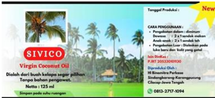
Gambar 4 Label kemasan produk UMKM VCO

merupakan salah satu wujud komunikasi pemasaran yang bisa dilakukan tetapi lebih menekankan pada brand /merek (Rosilawati 2008). Brand atau merek adalah nama, istilah, tanda, simbol desain ataupun kombinasinya yang mengidentifikasi suatu produk atau jasa yang dihasilkan oleh suatu perusahaan (Nurhayati 2017).