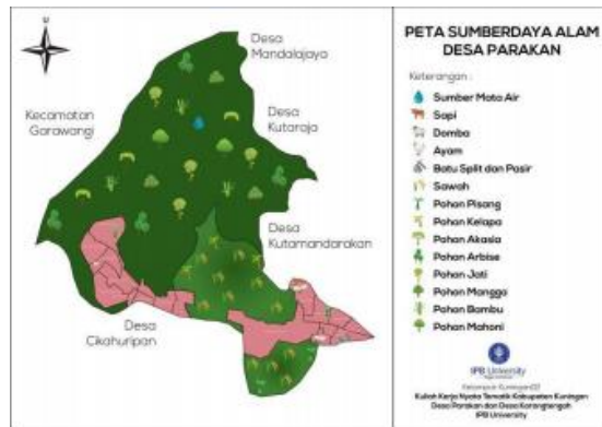
Gambar 3 Peta potensi sumber daya alam Desa Parakan