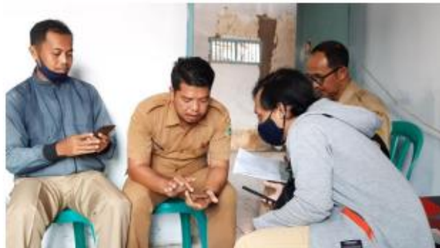
Gambar 1 Kegiatan wawancara perangkat desa

Kemudian data hasil wawancara dan kunjungan pada kedua desa mengenai potensi sumberdaya alam yang dimiliki dipadukan agar hasil data yang diperoleh akurat. Sehingga luaran yang dihasilkan dari kegiatan tersebut adalah berupa data potensi sumberdaya alam di Desa Parakan dan Desa Karangtengah. Kemudian data tersebut digunakan sebagai dasar untuk pemetaan potensi desa di program kegiatan selanjutnya. Dokumentasi kegiatan wawancara potensi sumberdaya alam bersama perangkat desa serta dokumentasi kegiatan kunjungan lapang tersaji pada Gambar 1 dan Gambar 2.