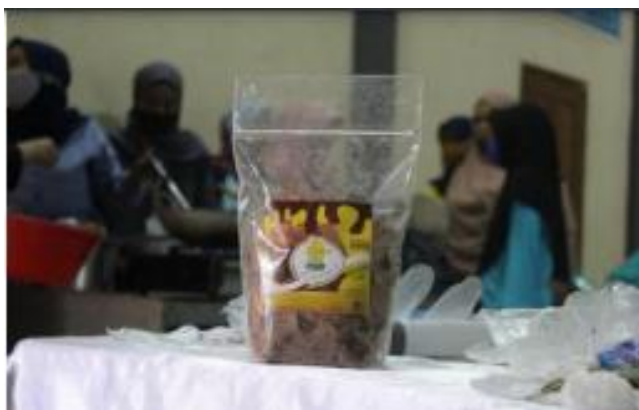
Gambar 5 Inovasi olahan produk keripik pisang rasa coklat

Melalui pelatihan pembuatan inovasi olahan keripik pisang rasa coklat oleh KWT sebagai salah satu strategi pengembangan ekonomi dalam rangka meningkatkan taraf hidup masyarakat desa dengan memanfaatkan sumberdaya dibidang pertanian, olahan keripik pisang rasa coklat dapat dikembangkan menjadi home industry dan diharapkan dapat menjadi produk unggulan KWT Karang Lestari di Desa Karang Tengah. Luaran yang dihasilkan dari program ini adalah inovasi olahan produk keripik pisang rasa coklat beserta packaging dan desain kemasannya seperti yang tersaji pada Gambar 5.