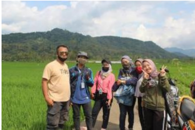
Gambar 2 Kegiatan kunjungan lapang

Hasil dari kegiatan ini adalah berhasil mendata potensi sumberdaya alam Desa Parakan dan Desa Karangtengah. Kendala yang dialami selama kegiatan adalah sebagian besar wilayah di desa tersebut merupakan hutan, sehingga akses yang ditempuh untuk kunjungan lapang sulit dan tidak memungkinkan sehingga pendataan di daerah hutan tersebut hanya berdasarkan hasil wawancara perangkat desa, tidak dilakukan kunjungan lapang secara langsung.