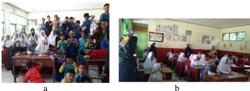
Gambar 2a) Dokumentasi kegiatan di SDN Selabintana Wetan dan b) SMAN 1 Sukabumi

Gerakan Belajar mengenal alam (GERBERA) bertujuan meningkatkan pengetahuan siswa terhadap pentingnya menjaga alam dimulai dari pendidikan dini, mengetahui jenis flora dan fauna khas Desa Sudajaya Girang dan mampu memanfaatkan secara lestari flora khas daerah seperti pembuatan herbarium. Pembuatan vertikal garden diharapkan mampu mengenalkan kepada siswa jenis flora khas Desa dan peduli terhadap lingkungan agar menjadi lebih bersih dan indah. Pengenalan pembuatan herbarium diharapkan dapat menjadi penunjang kegiatan belajar mengajar sekain itu siswa dapat berwirausaha membuat kerajinan dari herbarium kering seperti gantungan kunci dan pembatas buku