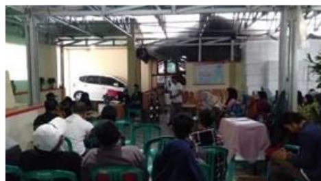
Gambar 3 Kegiatan SUJI (Sosialisasi Upaya Jalma Inisiasi Kampung Flori)

Suji merupakan salah satu tanaman hias yang menjadi khas di Sukabumi khususnya di Desa Sudajaya Girang. Sosialisasi kampung flori merupakan salah satu program berupa diskusi langsung terkait perencanaan pembangunan kampung flori yang diinisiasi oleh Kelompok Tani Alamanda sebagai Asosiasi Flori Sukabumi (Gambar 3). Pelaksanaan