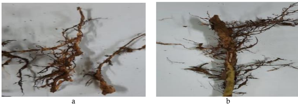
Gambar 8 Akar tanaman jambu biji yang terserang Meloidogyne sp. (a) dan Radholupus sp. (b) di desa Cibening.