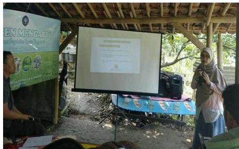
Gambar 4 Sosialisasi dan pelatihan strategi pengendalian hama dan penyakit pada jambu biji