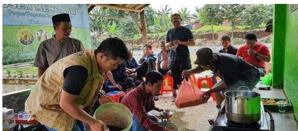
Gambar 5 Praktik pembuatan PGPR bersama petani di desa Cibening

Hama utama yang ditemukan di lapangan antara lain kepik Helopeltis spp. Gejala serangan terlihat pada buah dan pucuk berupa titik-titik hitam bekas tusukan Helopeltis