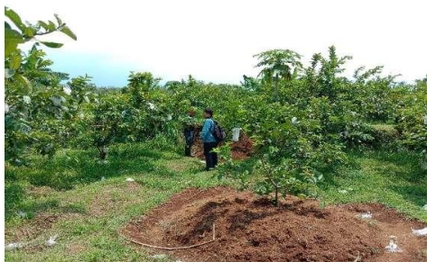
Gambar 3 Survey hama dan penyakit pada pertanaman jambu biji di Desa Cibening

Secara sederhana pembuatan PGPR dapat dilakukan melalui tiga tahap mengikuti prosedur kerja yang dilakukan Ali (2018), yaitu penyediaan bahan biakan bakteri (biang),