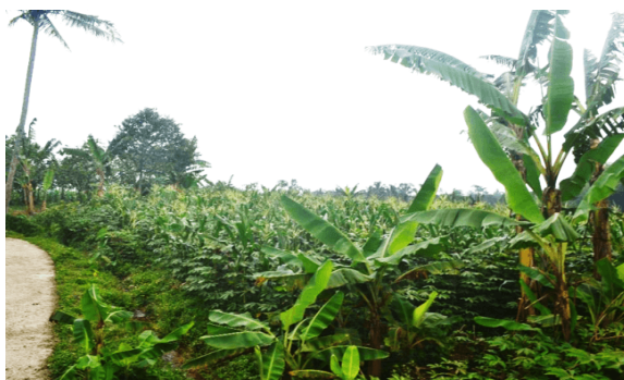
Gambar 2 Konversi komoditi dari jambu biji menjadi jagung di desa Cibening.

Dengan kondisi yang terjadi di desa tersebut, perlu dilakukan upaya penyelesaian masalah. Melalui program dosen mengabdikan dan SLAK IPB 2019, tim mengemas program edukasi yang bertujuan untuk memperkenalkan berbagai hama dan penyakit pada tanaman jambu biji kepada petani. Pengenalan ini meliputi identifikasi hama dan penyakit (mayor atau minor), stadia menyerang, waktu menyerang (Nokturnal atau diurnal), gejala yang ditimbulkan dan rekomendasi pengendaliannya serta melakukan pelatihan langsung pembuatan agensia hayati (PGPR), sehingga petani mampu memahami dan mengelola serta menerapkan pengendalian hama dan penyakit secara mandiri dan terpadu kedepannya.