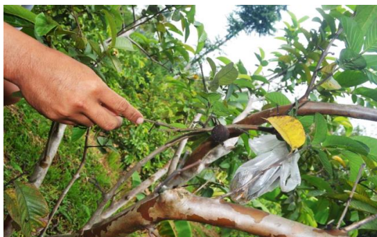
Gambar 6 Gejala serangan Helopeltis sp. pada jambu biji di desa Cibening

Rangkaian kegiatan sosialisasi ini dilakukan oleh tim dengan tema “Pengenalan organisme pengganggu tanaman (OPT) pada tanaman jambu biji dan strategi pengendalian yang berbasis ramah lingkungan”. Kegiatan ini diikuti oleh 30 petani jambu biji yang antusias berdiskusi terkait kendala budidaya dan pengelolaan hama penyakit pada jambu biji.