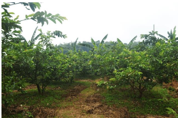
Gambar 1 Lahan jambu biji di desa Cibening, Kecamatan Pamijahan.

Saat ini, mayoritas penduduk di desa Cibening, Pamijahan berprofesi sebagai petani sekaligus peternak ikan, terdapat 30 petani yang membudidayakan jambu biji di desa ini. Jambu biji tersebut dibudidayakan di areal lahan seluas 10 hektare (Gambar 1). Dalam pengelolaan hama dan penyakit, petani di Desa Cibening biasanya langsung menggunakan pestisida kimiawi dengan alasan lebih praktis dan kurang memahami konsep PHT. Sebagian besar petani di desa ini justru petani peralihan dari petani sawah (padi) menjadi petani tanaman tahunan seperti jambu biji. Berbekal pengalaman menggunakan pestisida di sawah, petani jambu biji di desa ini juga terbiasa menggunakan pestisida yang biasa disemprotkan untuk hama dan penyakit pada tanaman padi.