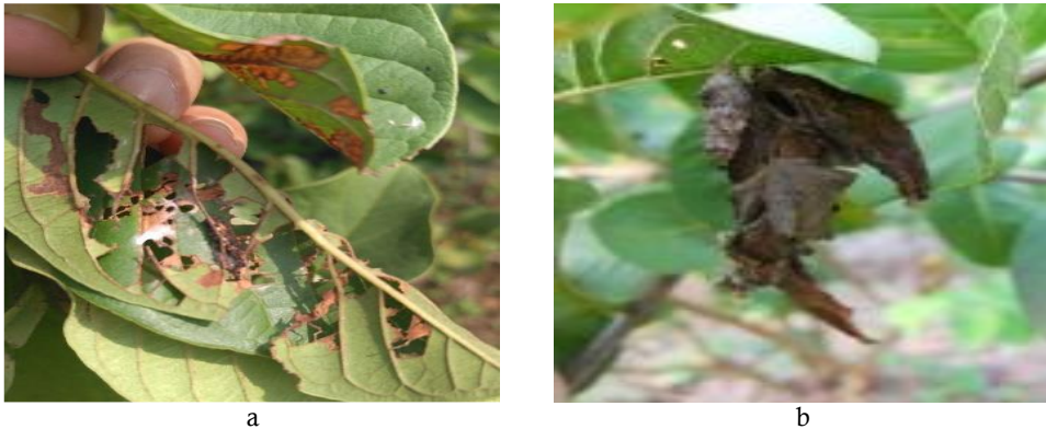
Gambar 11 Gejala daun berlubang (a) yang disebabkan oleh ulat kantung (b).

telah dilaporkan pada tanaman inang yang memiliki lebih dari 203 genus di 77 famili tanaman. (CABI 2016).