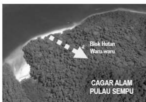
Gambar 1 Lokasi penelitian Blok Hutan Waru-waruu, Cagar Alam Pulau Sempu

Data yang dikumpulkan adalah nama dan jumlah individu pohon (pada setiap fase pertumbuhan) dan tumbuhan bawah, ukuran diameter batang setinggi dada, serta kondisi lingkungan (pH tanah, suhu dan kelembaban, dan intensitas cahaya).