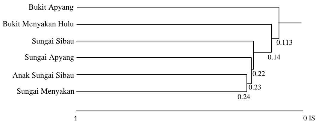
Gambar 2. Dendrogram kesamaan jenis burung antar lokasi di DAS Sibau, TNBK

Keterangan : SS = Sungai Sibau; SA = Sungai Apyang; SM = Sungai Menyakan; AS = Anak Sungai Sibau; BA = Bukit Apyang; BM = Bukit Menyakan Hulu