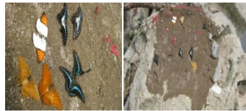
Gambar 2. Sekumpulan kupu-kupu mati di bebatuan.

Pengamatan di daerah riparian tepatnya di bagian pinggir sungai, menjumpai kupu-kupu mati pada tumpukan pasir di atas bebatuan. Di sepanjang jalur pengamatan banyak ditemukan letak tumpukan pasir dengan adanya bekas urine manusia yang terdapat bangkai kupu-kupu. Bangkai kupu-kupu tersebut terdiri dari beberapa jenis dengan jumlah sekitar 10 individu setiap tumpukan pasir. Kupu-kupu mati di bebatuan di daerah pinggiran sungai dapat dilihat pada Gambar 2.