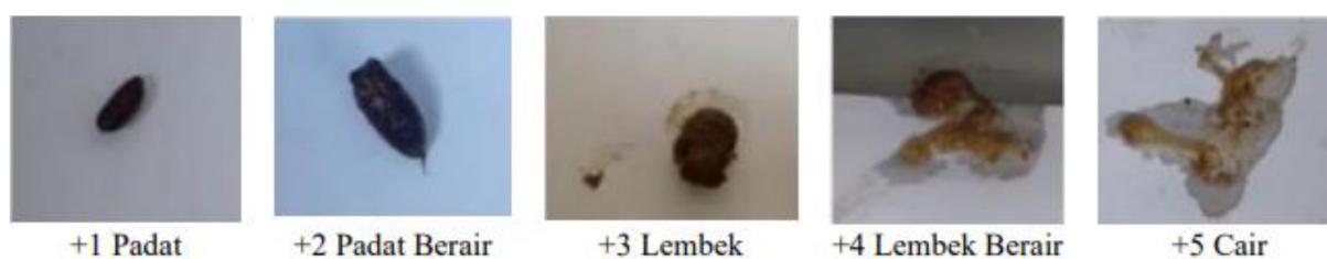
Gambar 2. Skoring Konsistensi Feses

Kontrol positif menunjukkan rata-rata waktu terjadinya diare pada menit ke-65 dengan durasi diare selama 60 menit. Sediaan dengan konsentrasi 25% menunjukkan rata-rata waktu terjadinya diare pada menit ke-105 dengan durasi diare 55 menit. Sediaan dengan konsentrasi 50% menunjukkan rata-rata waktu terjadinya diare pada menit ke-80 dan durasi diare selama 100 menit, sedangkan sediaan dengan konsentrasi 100% menunjukkan rata-rata