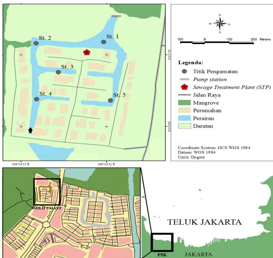
Gambar 1. Stasiun pengambilan contoh di Danau Hias Gold Coast

Pengambilan contoh dilaksanakan setiap bulan dari Januari hingga Desember 2016. Pengamatan dan pengukuran kualitas air secara in situ dan pengambilan contoh plankton dilakukan pada lima stasiun di Danau Hias Gold Coast , Bukit Golf Mediterania, Pantai Indah Kapuk, Jakarta Utara (Gambar 1). Analisis contoh plankton dan kualitas air dilakukan di Laboratorium Produktivitas dan Lingkungan Perairan, Departemen Manajemen Sumberdaya Perairan, Fakultas Perikanan dan Ilmu Kelautan, Institut Pertanian Bogor. Stasiun 1 berada di dekat Sewage Treatment Plant dan Pump Station di bagian Utara; Stasiun 2 berada di sisi Barat; Stasiun 3 di tengah, dan Stasiun 4 di Barat Daya yang berdekatan dengan saluran koneksi antarperairan di Bukit Golf Mediterania; dan Stasiun 5 di bagian Tenggara yang berada pada lekukan dan di ujung perairan Gold Coast .