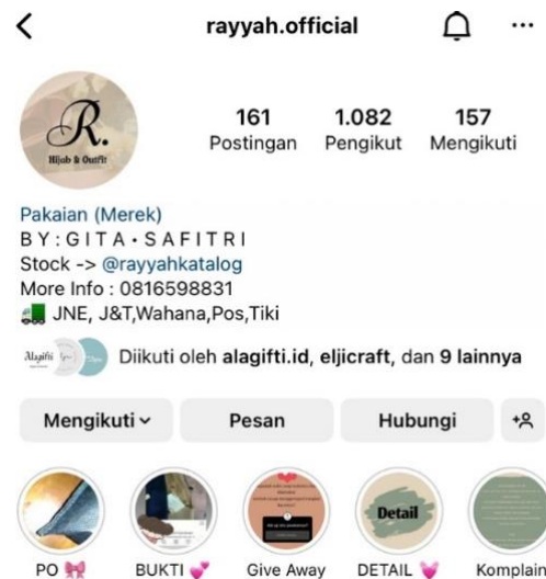
Gambar 1. Media Sosial Instagram Brand Hijab Rayyah