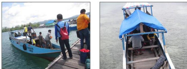
Gambar 2. Akses kapal nelayan yang digunakan pengunjung dari Langgapulu (kiri) dan Desa Namu, Dusun 2 (kanan)