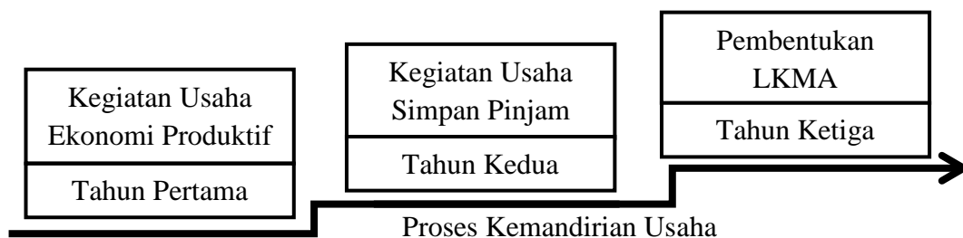
Gambar 1. Tahapan Proses Pembinaan Kelembagaan PUAP

Sesuai proses pembinaan kelembagaan PUAP, tahun pertama dana PUAP dimanfaatkan untuk membiayai usaha produktif sesuai dengan Rencana Usaha Anggota (RUA), Rencana Usaha Kelompok (RUK), dan Rencana Usaha Bersama (RUB). Tahun kedua, Gapoktan mengembangkan Usaha Simpan Pinjam. Dan tahun ketiga, Gapoktan membentuk LKMA. Proses pembinaan kelembagaan PUAP disajikan pada Gambar 1 di bawah ini.