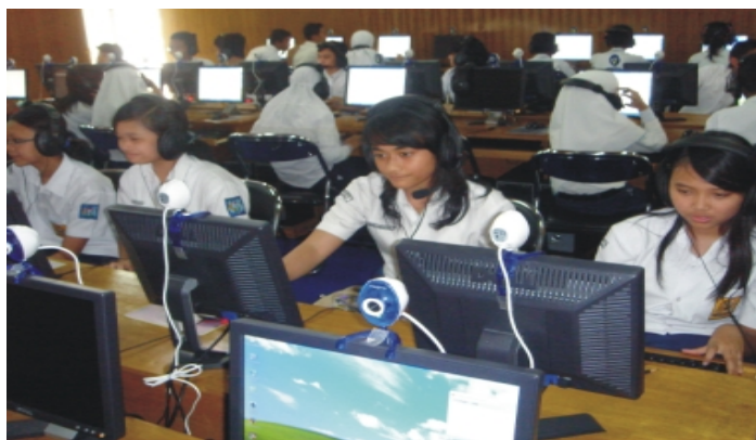
Gambar 4 Aktivitas Praktikum komputer di jenjang pendidikan dasar SMP

Pemahaman tentang perlunya SDM yang berkualitas, sebagai contoh, dapat dilihat secara langsung dari muatan kurikulum di sekolah-sekolah yang telah membawa elemen ICT sebagai pokok bahasan khusus yang disertai dengan penyediaan perangkat komputer yang mencukupi (Gambar 4). Program ini diharapkan mampu memperkecil digital divide di Indonesia serta mempersiapkan SDM baru yang siap memanfaatkan ICT.