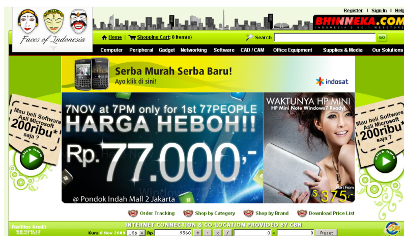
Gambar 5. Situs e-shop http://bhinneka.com

Aktivitas ekonomi di Indonesia pun turut terimbas dengan ICT, diantaranya dengan munculnya beragam unit bisnis yang memanfaatkan internet sebagai media usaha. Sebagai contoh adalah bhinneka.com (Gambar 5) yang merupakan e-shop yang cukup sukses di Indonesia. Dari sini tampak bahwa elemen kreativitas dari dunia usaha turut berkembang dan secara perlahan meletakkan pondasi mikro menuju pasar bebas.