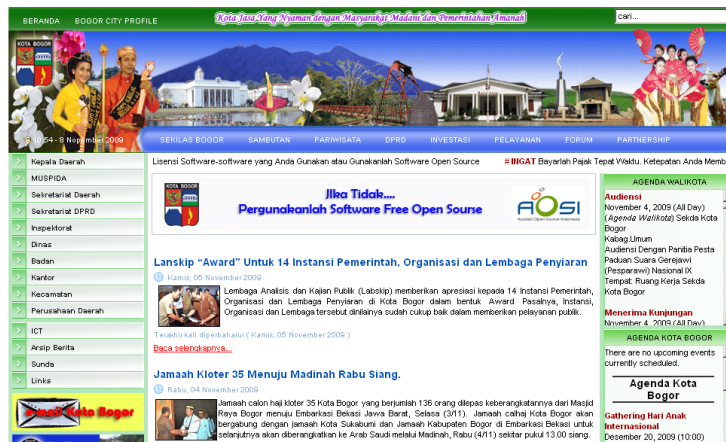
Gambar 9 Situs portal e-government kota bogor ( http://kotabogor.go.id ).

birokrasi yang sering muncul dalam proses layanan konvensional. Sebagai contoh adalah portal e-government Kota Bogor (Gambar 9).