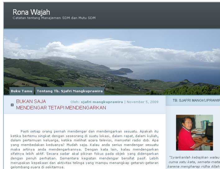
Gambar 7 Situs Blog http://ronawajah.wordpress.com

yaitu dari 130.000 blogger pada Tahun 2007 menjadi 600 ribu di Tahun 2008 dan menjadi 1.2 juta blogger pada tahun 2009.