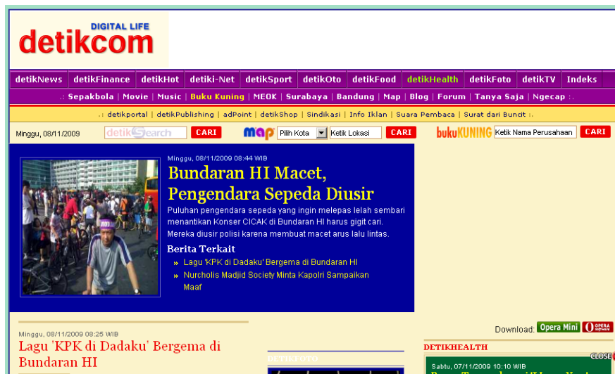
Gambar 6. Situs e-news http://detik.com

Globalisasi yang disertai dengan globalisasi arus informasi dan perkembangan ICT akan melahirkan masyarakat yang lebih menghargai kualitas individu, sehingga terbentuk masyarakat kompetitif dan menghargai aspek intelektual individu secara lebih baik. Dari aspek penyebaran informasi, aspek ICT telah membawa perubahan yang sangat mendasar, seperti munculnya koran elektronik seperti detik.com (Gambar 6), kemampuan penyampaian informasi dari belahan dunia yang lain secara cepat dan akurat menyebabkan semakin hilangnya jarak ruang dan waktu.