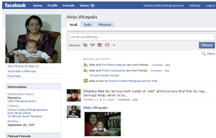
Gambar 8. Situs social network http://facebook.com

Pemerintah pun, tidak ketinggalan meningkatkan layanannya melalui sistem e-government. Berbagai aplikasi dikembangkan dengan tujuan mempermudah dan memotong proses