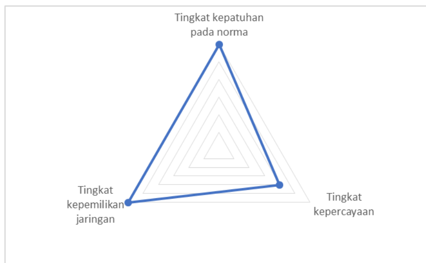
Gambar 1. Tingkat unsur-unsur modal sosial yaitu tingkat kepemilikan jaringan, tingkat kepatuhan pada norma, dan tingkat kepercayaan

Analisis modal sosial dalam penelitian ini dilihat dari tiga unsur-unsurnya yaitu tingkat kepemilikan jaringan, tingkat kepatuhan pada norma sosial, dan tingkat kepercayaan terhadap lingkungan sosial. Masing-masing unsur ini dilihat dari komponen penyusunnya yang menunjukkan rata-rata nilai modal sosial rumah tangga di Desa Pasirtalaga Kecamatan Talagasari, Kabupaten Karawang. Berikut adalah gambar tiga unsur modal sosial secara umum di Desa Pasirtalaga, Kecamatan Talagasari, Kabupaten Karawang.