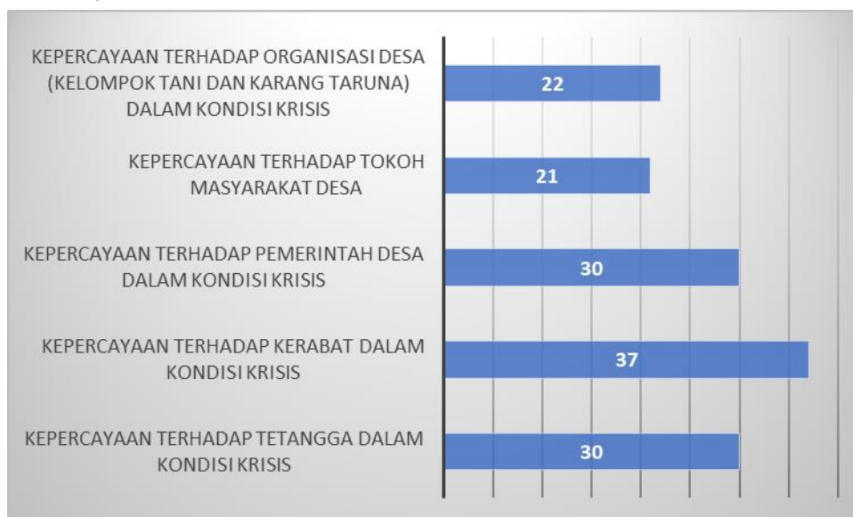
Gambar 4. Jumlah rumah tangga petani berdasarkan unsur-unsur tingkat kepercayaan kepada lingkungan sosial

adalah gambar yang menunjukkan jumlah rumah tangga petani yang memiliki kepercayaan terhadap lingkungan sosialnya.