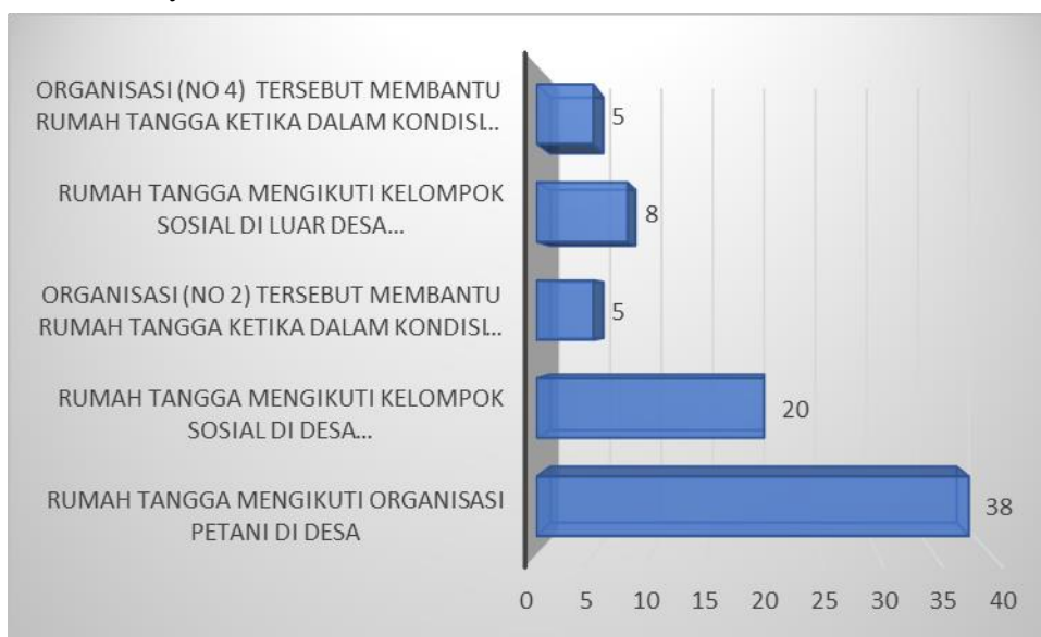
Gambar 3. Jumlah rumah tangga petani berdasarkan unsur-unsur tingkat kepemilikan jaringan

Unsur kedua dari modal sosial yaitu tingkat kepemilikan jaringan. Hipotesis yang dikembangkan yaitu semakin banyak jaringan yang dimiliki oleh rumah tangga petani, maka semakin banyak pihak yang diyakini dapat membantu rumah tangga petani ketika menghadapi krisis akibat pandemi covid-19. Berikut adalah gambar yang menunjukkan kepemilikan jaringan oleh rumah tangga petani yang terdiri dari kelompok tani di desa, kelompok sosial di dalam desa dan manfaatnya, serta kelompok sosial di luar desa dan manfaatnya.