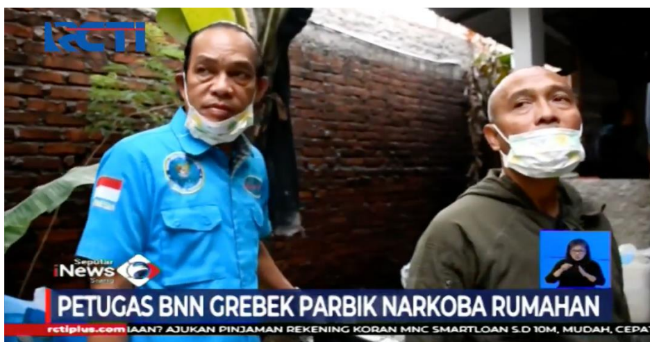
Gambar 1. Potongan Gambar dari Video Program Berita Seputar iNews Siang di RCTI

Namun fenomena yang terjadi dalam hal memahami aksesibilitas informasi televisi masih rendah terhadap kebutuhan penyandang tunarungu. Fenomena tersebut meliputi belum tersedianya akses sarana informasi dan komunikasi terhadap penyandang tunarungu pada media. Belum adanya pergerakan cara bagaimana untuk pemenuhan hak informasi dan komunikasi bagi penyandang tunarungu. Sampai saat ini, ada beberapa stasiun televisi yang masih menggunakan interpreter bahasa isyarat dalam siaran beritanya antara lain SCTV, TVRI, RCTI, CNN, NET TV, Kompas TV, Trans TV dan TvOne (dikutip dari kompasiana.com pada pukul 20.33 WIB (22/01)). Dikutip dari kpi.go.id, RCTI kini menjadi program berita nomer satu di Indonesia pada akhir tahun 2019. Salah satu konten berita yaitu Seputar Indonesia kini berganti nama menjadi Seputar iNews Siang di mana ada fitur penerjemah bahasa isyarat yang disajikan pada program beritanya yang bernama Seputar iNews Siang.