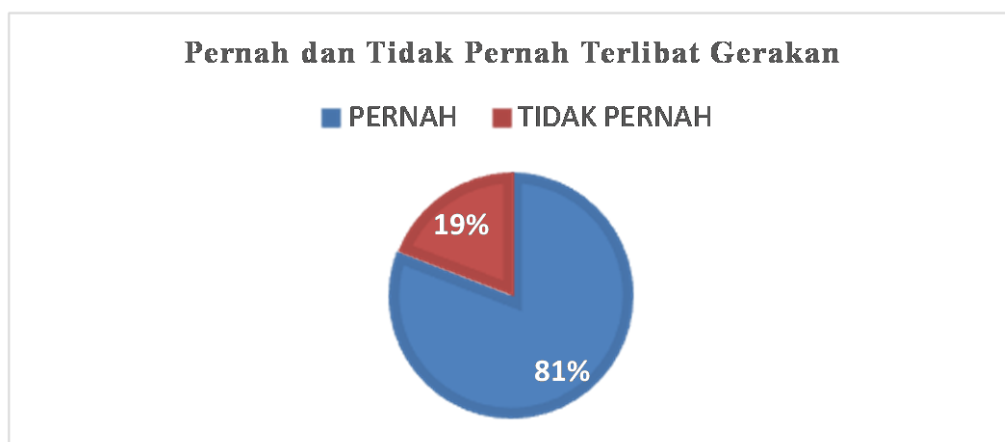
Gambar 1. Persentase petani yang pernah dan tidak pernah ikut dalam gerakan

Partisipasi petani dalam gerakan sosial ini cenderung mengalami perubahan seperti disajikan dalam Gambar 1 dan 2. Persentase perubahan partisipasi didapat dari kesaksian informan terhadap seluruh kepala keluarga yang lahannya masuk dalam arena konflik. Presentase perubahan pada Gambar 1 dinilai dari keaktifan petani pada fase awal gerakan pada tahun 2015-2016 saat masuknya aktor gerakan intelektual organik dan fase gerakan saat ini antara 2018-2019 saat penelitian ini dilaksanakan seperti tersaji pada gambar 2.