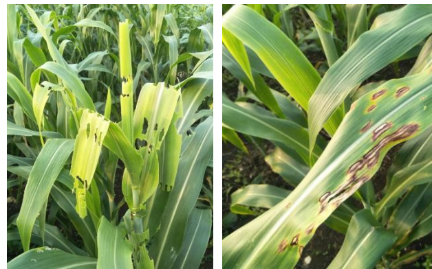
Gambar 2 Infeksi hama pada sorgum

A0 = Tanpa penambahan asam borat; A1 = asam borat 10 ppm (setara 0,360 g H 3 BO 3 /5L); A2 = asam borat 20 ppm (setara 0,720 g H 3 BO 3 /5L); A3 = asam borat 30 ppm (setara 1,080 g H 3 BO 3 /5L); A4 = asam borat 40 ppm (setara 1,440 g H 3 BO 3 /5L). abc Superskrip yang berbeda pada baris yang sama menunjukkan hasil yang berbeda nyata ( p < 0,05 ).