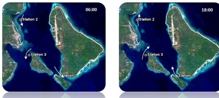
Gambar 3. Pola arus sewaktu perairan pulau Gumilamo dan Magaliho.

Pada tiap interval waktu sampling, di ketiga stasiun sampling terjadi perubahan kelimpahan diatom. Secara umum diatom pada Stasiun 1 dan 2 meningkat kelimpahannya pada jam 06:00 dan menurun pada jam 12:00. Sedangkan pada Stasiun 3 diatom melimpah pada jam 00:00 dan mengalami penurunan sampai jam 12:00.