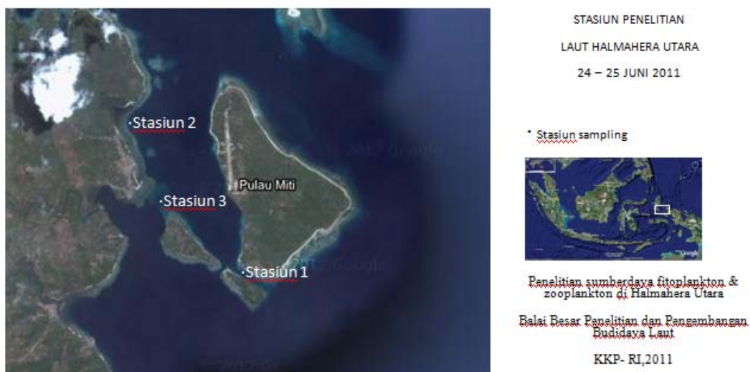
Gambar 1. Peta lokasi sampling di perairan pulau Gumilamo dan Magaliho.

Pada jam 06:00 arus menuju ke Stasiun 1 dimana dimungkinkan arus membawa diatom dari perairan sekitar Stasiun 3, dan begitu juga terjadi pada Stasiun 2 dimana arus berasal dari luar perairan pulau Gumilamo. Hal ini menyebabkan diatom melimpah pada kedua stasiun tersebut. Sedangkan pada Stasiun 3 arus meninggalkan lokasi yang menyebabkan menurunnya kelimpahan diatom.