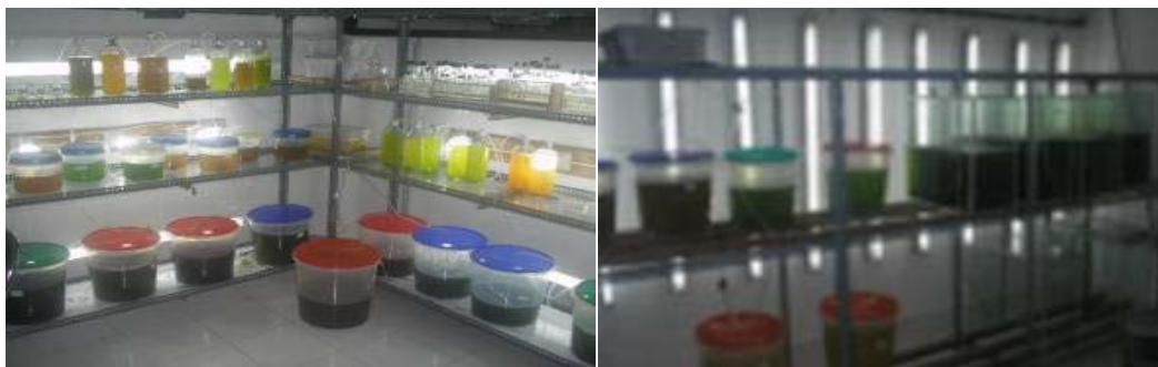
Gambar 2. Laboratorium pakan alami.