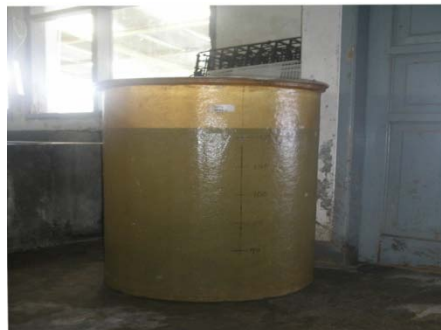
Gambar 1. Bak pendederan larva kerang mutiara ( Pinctada maxima ).

ruangan. Pendistribusian larva pada bak-bak pendederan sesuai ukuran larva dilakukan dengan menggunakan saringan net palankton (screen net). Sementara dalam penelitian ini digunakan bak yang berbentuk silinder dengan kapasitas muat 200 liter air dan ditebar larva pada masing-masing bak sebanyak 5000 larva (Gambar 1). Pakan diberikan dari jenis alga antara lain Isochrysis galbana , Monochrysis luteri , Papulova luteri , Chaetoceros gracilis dan Tetra selmis dikultur dalam Laboratorium (Gambar 2). Pemasangan kolektor dilakukan setelah larva melewati masa kritis yaitu antara hari ke 20–30, dan biasanya rengs waktu tersebut bysus sebagai alat penempel mulai muncul yang ditandai dengan bintik hitam (eye spot) pada organ tubuhnya (Gambar 3). Kolektor terbuat dari ancaman helaian plastik menyerupai tikan yang berwarna gelap (hitam) dengan luas potongan 20x30cm 2 .