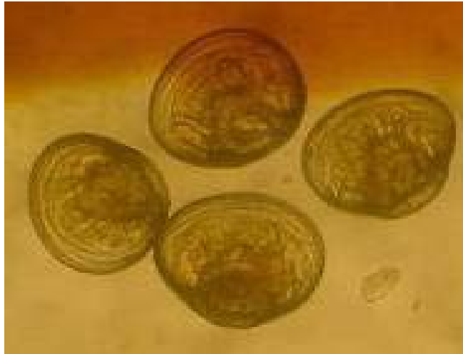
Gambar 3. Larva kerang mutiara pada stadia “eye spot”.

Pemilihan kolektor yang berwarna gelap adalah sesuai dengan hasil penelitian yang dilakukan oleh Hamzah (2003; 2007) bahwa pada umumnya larva kerang mutiara ( Pinctada maxima ) maupun kerang mabe ( Pteria penguin ) cenderung lebih senang menempel pada kolektor yang berwarna gelap. Aplikasi penggunaan kolektor yang berwarna gelap ini bukan saja digunakan di laboratorium UPT. Loka Pengembangan Bio Industri Laut Mataram, Puslit. Oseanografi – LIPI, namun ada beberapa perusahaan budidaya kerang mutiara di Indonesia yang tergolong skala industri antara lain PT. OMI (Oriental Mutiara Indonesia) di Muna, Sulawesi Tenggara, PT. Paloma Agung di Pulau Sumbawa, PT. Autore Pearl oyster di Kec. Pemenang, Lombok Utara dan PT. Mutiara Lombok di Kec. Tanjung, Lombok Utara. Pada masing-masing kedalaman perlakuan yaitu 20cm, 60cm dan 100cm dipasang kolektor dalam posisi vertikal dan horizontal sebanyak 3 lembar/ kedalaman dan diulang 3 kali (sebagai ulangan perlakuan). Perhitungan spat (benih) yang menempel pada kolektor dilakukan setelah berumur antara 40 – 45 hari dengan menggunakan rumus yang dikembangkan oleh Effendie (1979). Penggunaan rumus ini cukup sederhana yaitu hanya menghitung luas penampang