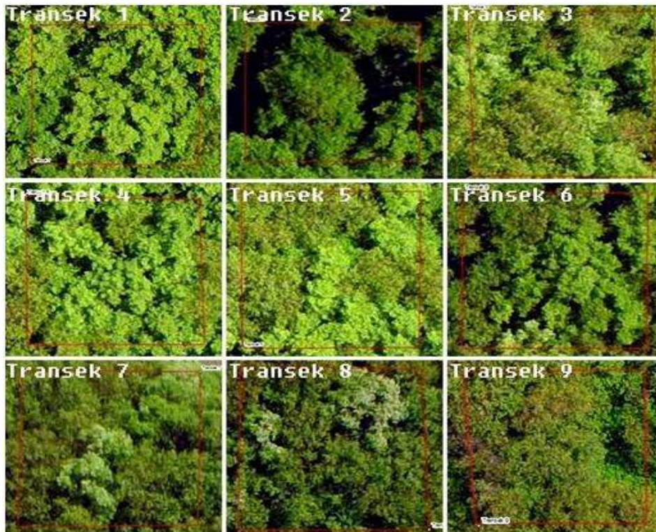
Gambar 1. Foto udara petak transek.

yang dilindungi, kupang, kijing, monyet ekor panjang dan berang-berang wregul. Berdasarkan data tersebut dapat ditentukan nilai bobot rata-rata untuk jenis satwa tiap transek penelitian yang ada di kawasan Pulau Lumpur yaitu sebesar 13,89 (Gambar 2).