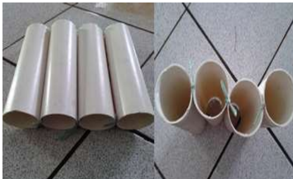
Gambar 1. Shelter paralon.

Penelitian ini menggunakan shelter berupa pipa paralon (Gambar 1) dengan panjang 25 cm dan berdiameter 5,5 cm. Jenis shelter yang digunakan diacuh dari panelitian sebelumnya yang dilakukan oleh Adiyana et al. (2014) yang menyatakan bahwa shelter jenis paralon mampu menekan tingkat stres pada lobster P. homarus .