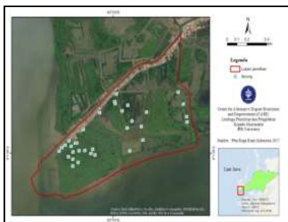
Gambar 10 Peta Persebaran Burung di Hutan Mangrove

Hasil analisis data indeks keanekaragaman burung, menunjukkan bahwa indeks keanekaragaman jenis burung di Kawasan Mangrove Desa Pantai Mekar pada tahun 2019 sebesar 2,842 sedangkan indeks pemerataan jenisnya sebesar 0,82. Hasil tersebut menunjukkan bahwa keanekaragaman jenis burung tersebar secara merata di Kawasan Mangrove Desa Pantai Mekar. Sejalan dengan pernyataan Odum (1993) yaitu sebaran merata apabila nilai indeks pemerataan jenis berkisar antara 0.6 - 0.8, apabila nilai indeks pemerataan jenis kurang dari 0.5 maka ditemukan jenis dalam jumlah yang lebih banyak dibanding dengan jenis yang lain (mendominasi). Berikut indeks keanekaragaman jenis, pemerataan jenis, dan kekayaan jenis burung di Kawasan Mangrove Desa Pantai Mekar tahun 2019 (Gambar 3).