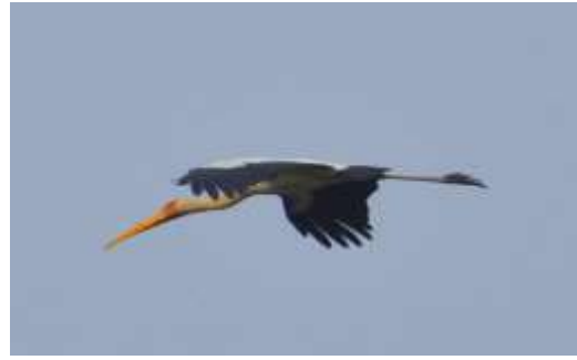
Gambar 5 Bangau bluwok ( Mycteria cinerea )

Pohon yang dijadikan sebagai berlindung dan beristirahat adalah pohon gelam ( Melaleuca leucadendra ). Pohon gelam ( Melaleuca leucadendra ) tumbuh tinggi, mempunyai tajuk yang rapat dan batang yang kuat serta tumbuh secara berkelompok membuat burung bangau bluwok memanfaatkan pohon tersebut sebagai tempat untuk berlindung dari gangguan predator dan beristirahat. Hal tersebut dapat dibuktikan dengan banyak ditemukannya kotoran-kotoran burung bangau bluwok di bawah pohon gelam (Syamal et al. 2008).