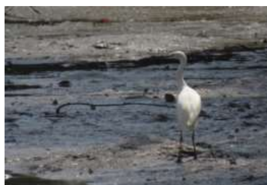
Gambar 4 Kuntul kecil ( Egretta garzetta )

Hasil inventarisasi burung di Desa Pantai Mekar ditemukan sebanyak 251 individu burung (Tabel 2). Terdapat 8 jenis burung yang termasuk jenis dominan dan sisanya sebanyak 24 jenis burung termasuk jenis nondominan. Dominansi jenis burung didapatkan dari membandingkan jumlah individu dari satu jenis burung dengan jumlah individu keseluruhan jenis burung. Berikut merupakan daftar jenis yang dominansi jenis burung di Kawasan Mangrove Desa Pantai Mekar (Tabel 3). Berdasarkan kriteria nilai indeks dominansi van Helvoort (1981) menyatakan bahwa apabila nilai indeks dominansi < 2% termasuk pada jenis nondominan, 2%-5% termasuk jenis sub-dominan, dan >5% maka jenis tersebut merupakan jenis yang dominan. Jenis burung yang paling dominan di Desa Pantai Mekar adalah Kuntul kecil ( Egretta garzetta ) dengan nilai sebesar 14.342629 (Gambar 4).