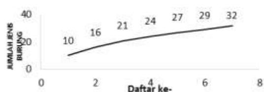
Gambar 9 Grafik pertambahan jenis burung tahun 2019

Penggunaan metode list jenis MacKinnon menghasilkan grafik penambahan jenis burung yang terdapat di Kawasan Mangrove Desa Pantai Mekar pada tahun 2019 (Gambar 1). Pertambahan jenis burung yang ditemukan, dicatat dan ditambahkan pada jenis di daftar sebelumnya.