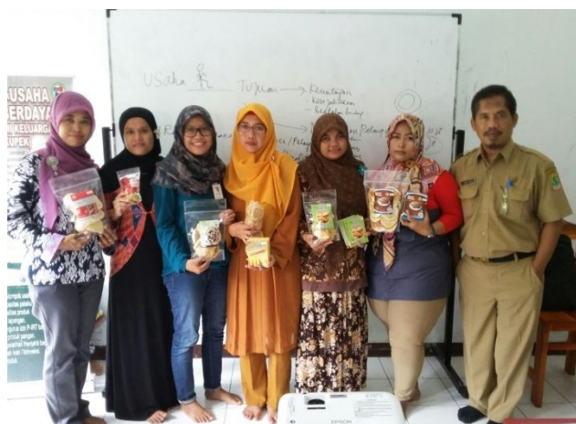
Gambar 4 Pelatihan peningkatan kualitas produk

Masalah internal berasal dari dalam organisasi KUPEK. Permasalahan yang muncul akibat dari permodalan untuk melakukan pelatihan