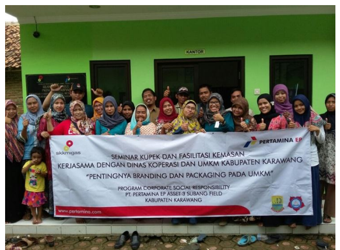
Gambar 3 Anggota KUPEK

Jenis pemasaran yang dilakukan oleh pelaku UKM setelah bergabung dengan KUPEK yakni sebagai berikut: Alur dari kegiatan KUPEK adalah UKM menitipkan barang dagangannya ke KUPEK untuk nantinya oleh KUPEK dijualkan ke beberapa tempat yang sudah mengikat kerjasama dengan KUPEK diantaranya, rumah makan, outlet oleh-oleh, dan rest area. KUPEK sendiri akan menyaring jenis UKM apa yang bisa masuk ke lokasi-lokasi kerjasamanya. UKM yang melakukan kerjasama dalam bidang pemasaran adalah UKM olahan pangan seperti terasi, berbagai jenis keripik, roti, makanan tradisional, dll. KUPEK sering mendapatkan tawaran untuk mengisi pameran yang dilaksanakan oleh instansi pemerintah maupun PT Pertamina Asset 3 Subang Field sehingga produk UKM yang bergabung di KUPEK sering dijadikan bahan pameran dan dikenalkan pada instansi pemerintah. Peran KUPEK dalam bidang pemasaran adalah untuk memperluas jaringan pemasaran UKM ke beberapa instansi pemerintah maupun swasta. Hal ini agar pemasaran produk anggota KUPEK tidak hanya terbatas di lingkungan sekitar UKM itu berproduksi tetapi sudah bisa merambah luas ke kecamatan lain, ke Kabupaten Karawang, atau bahkan sampai ke luar kota.