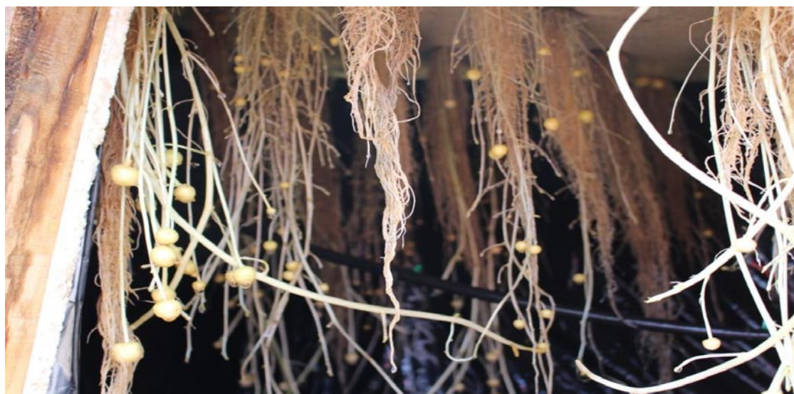
Gambar 2. Umbi mini kentang yang diproduksi dengan sistem aeroponik dan root zone cooling dengan tekanan pompa >1.5 atm pada 70 HST

Keterangan: suhu kontrol = tanpa pendinginan