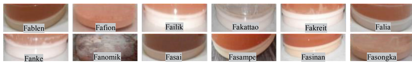
Gambar 3. Warna empulur dan pati berbagai aksesori sagu di Kecamatan Saifi, Kabupaten, Sorong Selatan, Papua Barat