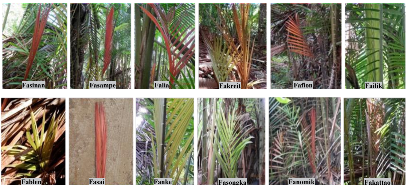
Gambar 2. Warna kuncup daun muda anakan berbagai aksesori sagu di Kecamatan Saifi, Kabupaten, Sorong Selatan, Papua Barat: merah (Fasampe), merah muda (Falia dan Fanomik), merah kecokelatan (Fafion, Fasai, dan Fakattao), merah kehijauan (Fasinan dan Fakreit), hijau kecokelatan (Fablen dan Fanke), dan hijau muda (Failik dan Fasongka)

Duri sagu sangat rapat pada pangkal pelepah baik pada fase anakan maupun dewasa. Akan tetapi, ketika dewasa duri pada pelepah daun mulai memendek dan membentuk pola yang bervariasi. Duri juga terdapat pada petiol dan rachis daun, namun tidak rapat. Duri-duri halus terdapat pada pinggir helaian anak daun yang semakin rapat pada bagian ujung daun. Limbongan (2007) menyatakan