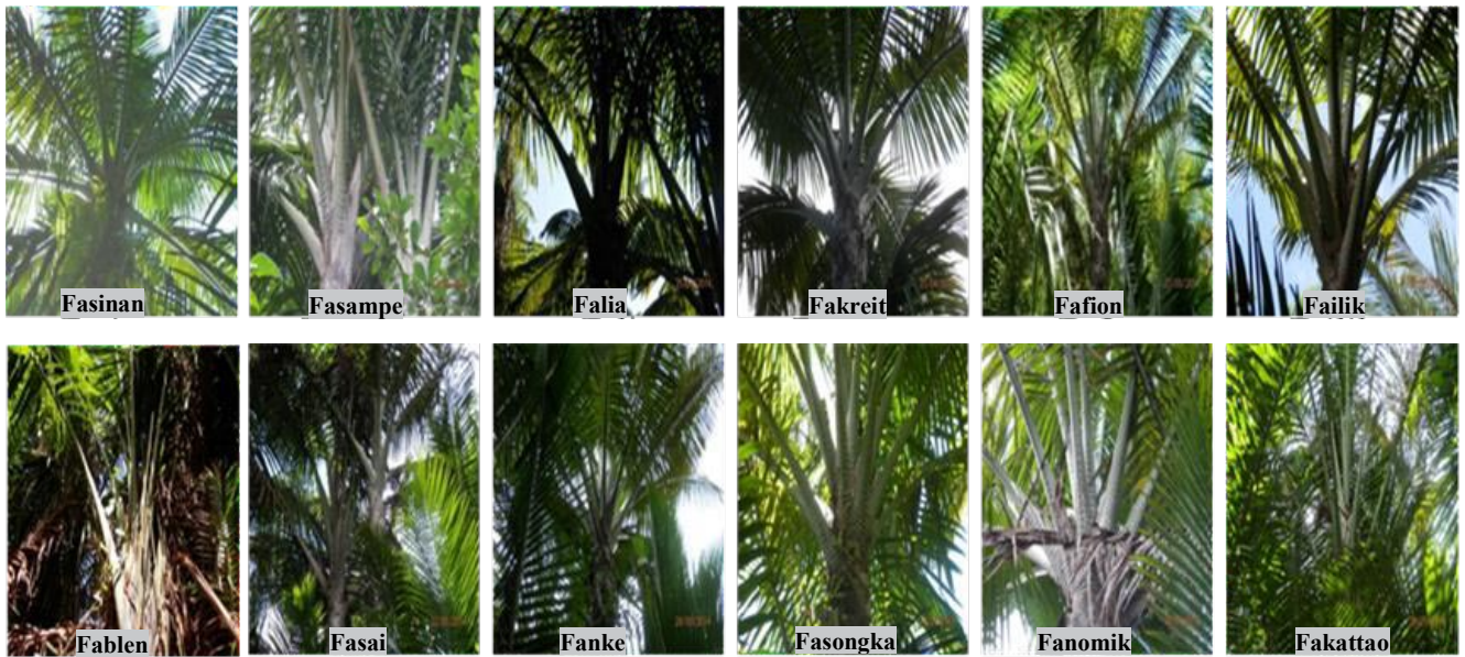
Gambar 1. Bentuk tajuk berbagai aksesori sagu di Kecamatan Saifi, Kabupaten, Sorong Selatan, Papua Barat (agak terbuka : Fasinan, Fakreit, dan Fanke)

beberapa batang yang bekas pelepah tuanya tidak nampak sehingga batang terlihat bersih dan licin.