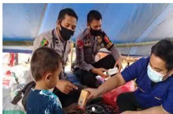
Gambar 4. Poko Kesehatan Kabupaten Luwu Utara di Area Bencana

Banyak pengungsi memiliki masalah kesehatan khususnya yang terkait dengan kesehatan air dan makanan yang dikonsumsi. Menurut data Badan Penanggulangan Bencana Daerah (BPBD) Kabupaten Luwu Utara, pada tahun 2020 ini beberapa pengungsi mengalami ISPA, diare, dermatitis dan hipertensi. Dari penyakit tersebut, penderita ISPA terbanyak sebanyak 247 orang, disusul ruam kulit 151 orang, hipertensi 137 orang dan diare 35 orang. Kemudian kelompok rentan seperti ibu hamil sebanyak 303 orang, bayi sebanyak 7 orang, anak kecil sebanyak 2223 orang dan lansia sebanyak 2623 orang. Dalam situasi bencana dan pascabencana, perempuan dan anak-anak merupakan kelompok paling rentan yang masih mendapat jaminan perlindungan. Hasil penyuluhan kesehatan yang dilakukan oleh Arham et al. , (2021) pada korban banjir di Desa Bandar Kedungmulyo, Kecamatan Bandar Kedungmulyo, Kabupaten