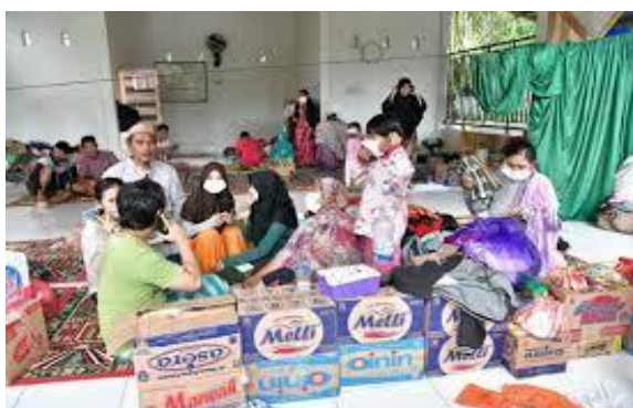
Gambar 3. Warga korban banjir yang mengikuti penyuluhan Kesehatan

Salah satu kegiatan penyuluhan yang diberikan pascabencana banjir Luwu Utara adalah penyuluhan kesehatan.