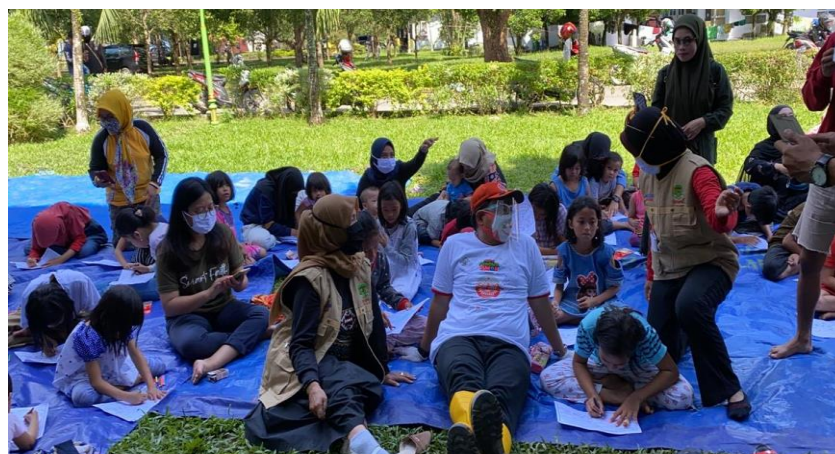
Gambar 2. Kegiatan Trauma Healing Korban Bencana Banjir Kecamatan Masamba Luwu Utara

impuls dan keterampilan analisis kausal yang baik/tinggi, sedangkan keterampilan rendah meliputi pada pengaturan emosi, empati, dan bunuh diri, efisiensi dan difusi. Oleh karena itu peran orang tua sangat penting dalam pengaturan emosi anak yang terdampak bencana banjir. Orang tua hendaknya mempersiapkan anak untuk menghadapi berbagai masalah dan hambatan dengan kemampuan pribadi yang baik dan tangguh. Kemampuan orang tua dalam membantu resiliensi anak agar tidak mengalami trauma sebagaimana trauma kedua orang tuanya disaat bencana terjadi. Untuk meningkatkan resiliensi tersebut, orang tua harus berempati, berkomunikasi dan memperlakukan anak secara positif (Novianti, 2018). Selain itu, dukungan pemerintah daerah dan masyarakat dapat berkontribusi pada ketangguhan korban banjir agar mereka dapat bertahan dan terus bersemangat serta pulih dari trauma pascabencana. Namun, bantuan pemerintah tidak mampu menutupi kerugian korban banjir terutama yang kehilangan harta benda dan rumah.