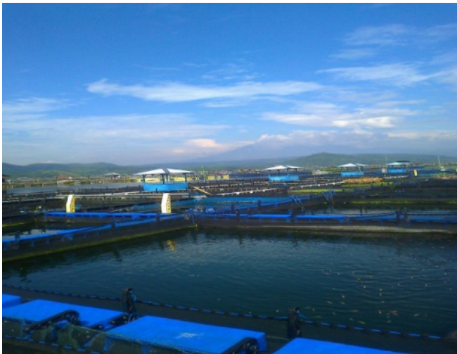
Gambar 2. Kontruksi Fiber KJA

KJA yang dipakai biasanya terdiri dari dua lapis jaring, lapis pertama terdiri dari 4 jaring dengan ukuran 7 \times 7 \times 2,5 \text{ m}^3 atau 3 \times 3 \times 3 \text{ m}^3 biasa digunakan untuk memelihara ikan mas dan lapis kedua merupakan 1 jaring dengan ukuran 15,8 \times 15,8 \times 5 \text{ m}^3 biasa digunakan untuk memelihara ikan nila. Jaring yang dipakai terbuat dari bahan polyethilen (PE) D.18 dengan mesh size (lebar mata jaring) antara 0,75-1 cm (Departemen Kelautan dan Perikanan 2003).