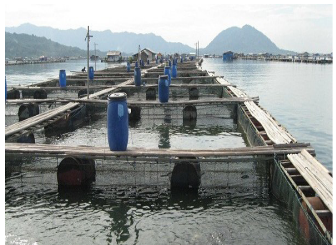
Gambar 2. Konstruksi Bambu KJA

Keramba jaring apung merupakan sistem budidaya dalam wadah berupa jaring yang mengapung dengan bantuan pelampung dan ditempatkan pada perairan di waduk Cirata. Sistem ini terdiri atas beberapa komponen yaitu rangka, kantong jaring, pelampung, jalan inspeksi, dan rumah jaga. Perkembangan inovasi teknologi konstruksi KJA mengalami pergeseran dengan menggunakan fiber pada tahun 2010, dengan melakukan percontohan dari Balai Pelestarian Pengelolaan Perairan dan Ikan Hias Provinsi Jawa Barat.