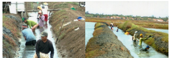
Gambar 3. Partisipasi Pembudidaya dalam Rehabilitasi Saluran

Menurut Uphoff (2000), komunitas yang memiliki modal sosial sedang memiliki komitmen terhadap upaya bersama dan kerjasama terjadi bila juga memberi keuntungan pada orang lain. Hal ini nampak pada pengelolaan irigasi tambak yang dilakukan secara partisipatif oleh pembudidaya ikan. Ketersediaan saluran irigasi tambak merupakan kebutuhan penting dalam menjamin ketersediaan air untuk kegiatan budidaya di tambak. Namun kenyataan di lapangan, kondisi saluran irigasi tambak banyak mengalami kerusakan dan tidak dapat melayani secara optimal kebutuhan air di tambak-tambak pembudidaya. Salah satu faktor penyebabnya adalah keterbatasan alokasi anggaran pemerintah untuk merehabilitasi irigasi tambak dan belum terbentuknya kelembagaan pengelolaan jaringan irigasi tambak yang baik. Untuk mengatasi kondisi tersebut, Kementerian Kelautan Perikanan menginisiasi suatu kegiatan yang bertujuan untuk menciptakan sistem pengelolaan irigasi tambak yang efisien dan efektif melalui peran serta partisipasi pembudidaya tambak itu sendiri dalam menjamin ketersediaan air untuk kegiatan budidaya ikan. Pelibatan peran serta pembudidaya ikan mulai dari perencanaan, pelaksanaan, pengawasan, dan monitoring evaluasi.