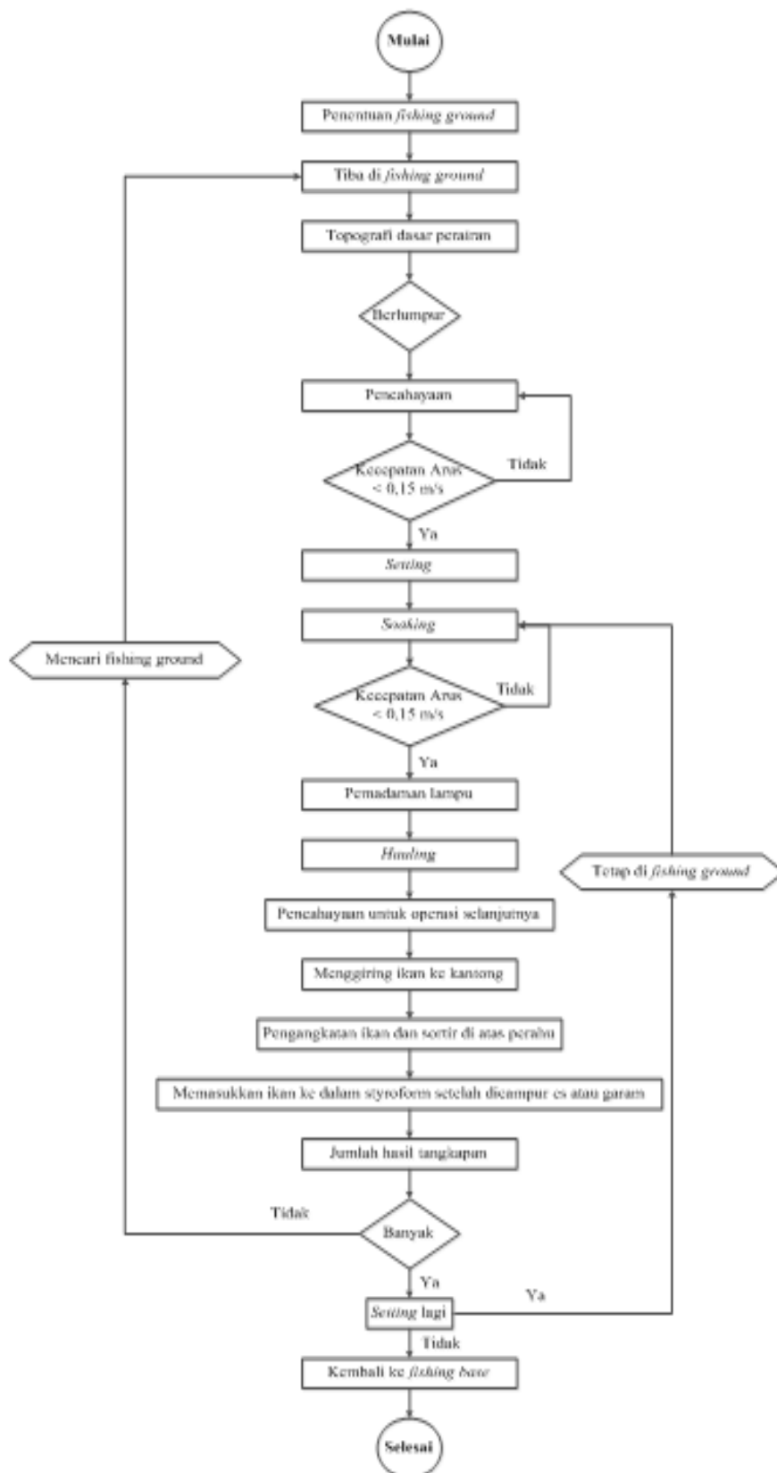
Gambar 3. Proses operasi penangkapan ikan pada bagan pete pete