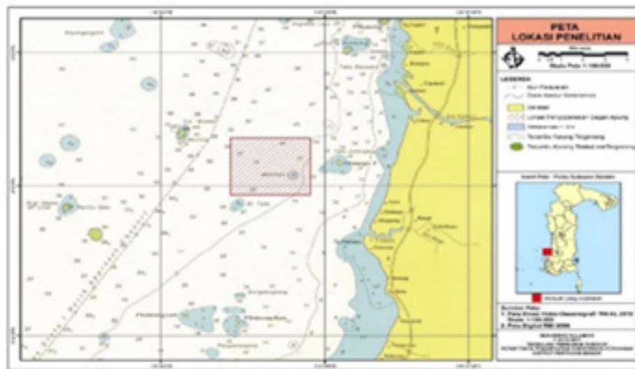
Gambar 1. Peta lokasi penelitian di perairan Barru Selat Makassar

Pola distribusi kawanan ikan di sekitar pencahayaan sebelum dan setelah proses penangkapan, pola kedatangan kawanan ikan di sekitar pencahayaan dan tingkah laku ikan di sekitar pencahayaan yang meliputi pola pergerakan di sekitar pencahayaan dianalisis secara deskriptif berdasarkan hasil pengamatan visual dan rekaman fish finder .