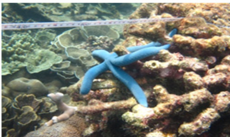
Gambar 3. Bintang laut biru jenis Linckia laevigata yang ditemukan pada lokasi pengamatan

laut di suatu lokasi terumbu karang, tidak dapat dijadikan suatu patokan ukuran untuk menggambarkan pola zonasi fauna echinodermata di tempat lain (Hammond et al. 1985). Menurut Namboodiri & Sivadas (1979) zonasi bisa dikaitkan dengan pendekatan bentuk dan macam substrat. Sloan (1980) juga menjelaskan bahwa sebagian besar bintang laut hidup di ekosistem terumbu karang, bintang laut Linckia Laevigata merupakan pemakan detritus dan lapisan busukan dari biota sessil bentos (Sloan 1980).