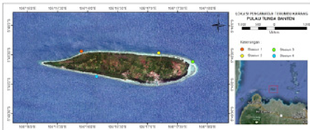
Gambar 1. Lokasi penelitian