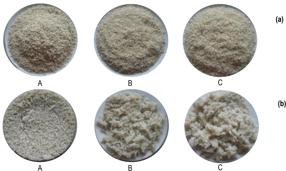
Gambar 2. Beras analog (a) dan Nasi analog (b) dari Jagung putih

Hasil uji sensorial beras analog dapat dilihat pada Tabel 7. Warna beras analog seperti terlihat pada Gambar 2(a) adalah putih agak krem. Aroma beras analog sangat ditentukan oleh bahan baku yang digunakan. Tepung jagung putih tidak memiliki aroma yang tajam, sehingga aroma beras analog tidak beraroma jagung.