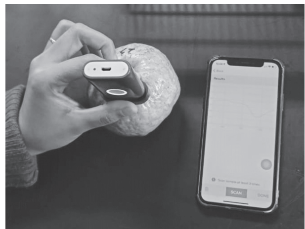
Gambar 1 Pengukuran reflektan dengan portable near-infrared spectrometer .

Menurut Ozaki et al. (2007) Spektra yang dihasilkan oleh instrumen NIR mengandung