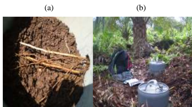
Gambar 1. (a) Sungkup untuk pengamatan rizosfer. (b) Sungkup saat pengambilan sampel gas

Pengambilan sampel gas dilakukan dari sungkup permanen yang telah dipasang enam bulan sebelumnya dalam kondisi tanpa tutup sungkup pada titik-titik pengamatan setiap transek. Sungkup untuk pengambilan sampel gas yang mewakili daerah rizosfer berupa paralon silinder berdiameter 30 cm dan tinggi 30 cm yang diberi lubang diameter 5 cm pada titik 20 cm dari atas permukaan paralon untuk memasukkan tiga buah akar agar tumbuh dalam paralon. Paralon tersebut diletakkan sejauh 2.5 m dari pokok batang untuk tanaman kelapa sawit. Sedangkan untuk pengambilan sampel gas non rizosfer dilakukan dengan memasang paralon silinder dengan ukuran yang sama tetapi tanpa dibuat lubang pada jarak 1 m dari paralon rizosfer (Gambar 1a).