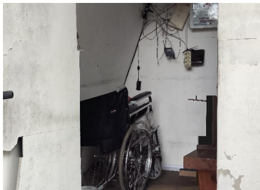
Gambar 6. Ketersediaan Kursi Roda di Grand Watudodol

Grand Watudodol dalam mendukung kegiatan pariwisata bagi penyandang disabilitas sudah menyediakan fasilitas dalam bentuk kursi roda yang dapat dipinjam melalui loket tiket, menurut hasil observasi keadaan kursi roda yang disediakan di daya tarik wisata Grand Watudodol telah sesuai dengan kebutuhan dan layak untuk digunakan. Ketersediaan Kursi Roda di Grand Watudodol dapat dilihat pada Gambar 6.