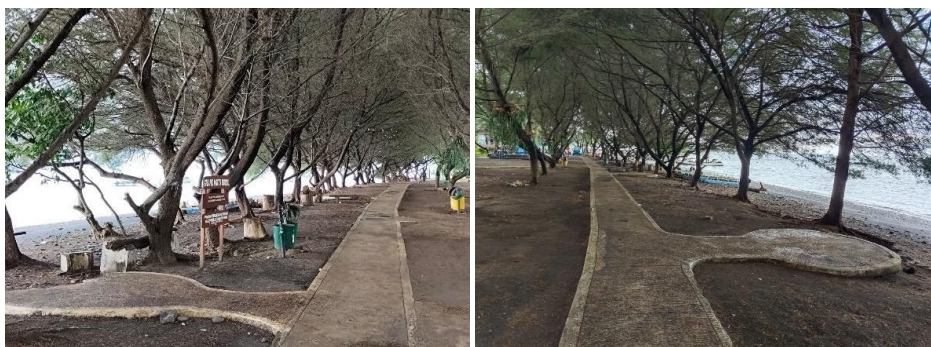
Gambar 5. Jalan Kursi Roda Grand Watudodol

Ketersediaan jalur pengguna kursi roda yang terdapat di daya tarik wisata Grand Watudodol menurut hasil observasi yang telah dilakukan dinilai cukup layak. Jalur kursi roda tersedia di sepanjang jalur area pantai yang saling terhubung dari pintu parkir menuju ke pinggiran area pantai dan fasilitas-fasilitas yang ada di Grand Watudodol. Jalan Kursi Roda Grand Watudodol dapat dilihat pada Gambar 5.