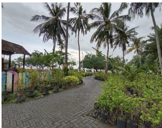
Gambar 7. Tidak ada jalur pemandu di Grand Watudodol