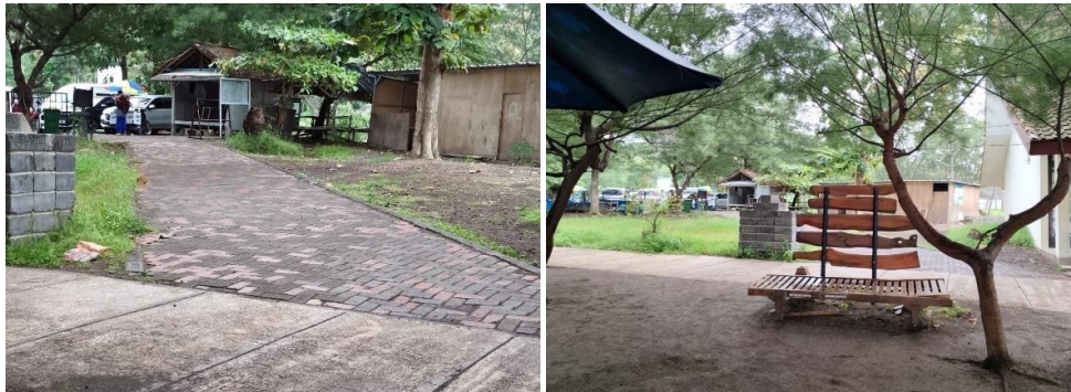
Gambar 3. Jalur Pedestrian Grand Watudodol