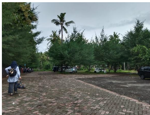
Gambar 4. Area Parkir Grand Watudodol

Area parkir pada Grand Watudodol terletak pada rute terdekat menuju area pintu gerbang masuk jalur pedestrian. Area parkir memiliki ruang bebas sehingga pengguna kursi roda bisa dengan mudah masuk dan keluar. Ketersediaan tempat parkir yang disediakan oleh Grand Watudodol dapat dinilai cukup layak, akan tetapi belum dilengkapi dengan simbol tanda parkir penyandang disabilitas. Sehingga untuk kesesuaian dengan Permen PU Nomor 30 Tahun 2006 masih kurang sesuai. Area Parkir Grand Watudodol dapat dilihat pada Tabel 4.